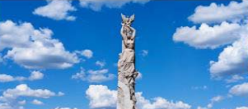
สวนประติมากรรมโลกฉางชุน