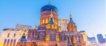
โบสถ์เซนต์ไอแซค

*ทางบริษัทฯ ขอสงวนสิทธิ์ในการสลับโปรแกรมทัวร์ตามความเหมาะสมขึ้นอยู่กับสถานการณ์บ้านงาน โดยคำนึงถึงผลประโยชน์ของลูกค้าเป็นสำคัญ