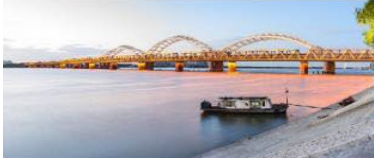
สะพานชงฮวาเจียง