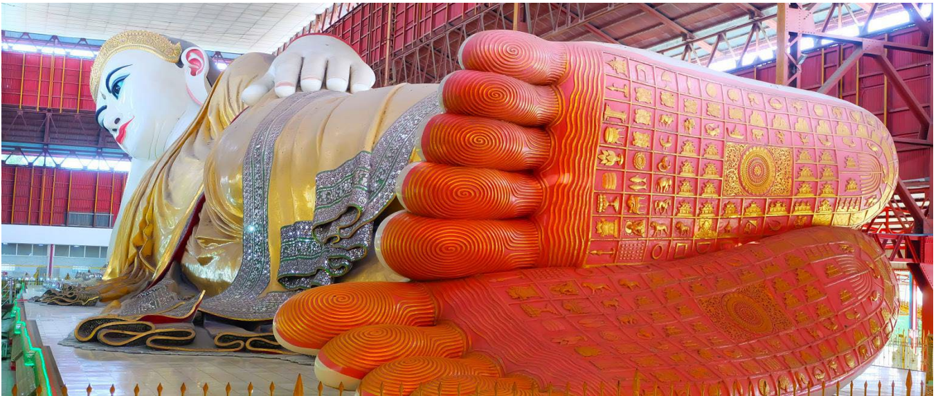
ลักษณะพระวิหิตวสมจริงและตรงชายประดับด้วยอัญมณีแวววาว ถือเป็นพุทธศิลป์ที่มีความงดงามทรงคุณค่า

นำท่านสักการะ พระพุทธรไสยาสน์เจ้าทัตติ หรือ พระนอนตาหวาน ซึ่งเป็นพระพุทธรไสยาสน์องค์ขนาดใหญ่ที่มีความสูงถึง 6 ชั้น ยาวกว่า 70 เมตร ใช้โครงเหล็กกันถึง 65 เมตร มีหลังคาคลุม 6 ชั้น สร้างขึ้นเมื่อปี 1907 ถูกยกย่องให้เป็นพระนอนที่มีขนาดใหญ่และงดงามที่สุดในพม่า ด้วยพระพักตร์ที่งดงามเปื้อนยิ้มดวงตาทำจากลูกแก้วที่สั่งผลิตจากต่างประเทศ ทาขอบตาด้วยสีฟ้าและมีขนตาหนายาวทำให้ดวงตาดูหวาน จนถูกเรียกพระนามอีกชื่อคือ “พระตาหวาน” บริเวณพระบาทมีภาพวาดลายธรรมจักร ตรงกลางฝ่าพระบาทล้อมรอบด้วยรูปมงคล 108 ประการ ที่แสดงถึงอากาศโลก สัตว์โลก และสังขารโลก อีกทั้งจิวรยังมี