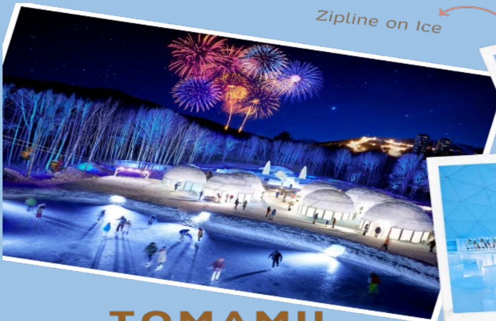
Zipline on Ice

จากนั้นนำท่านเดินทางสู่ TOMAMU ICE VILLAGE ซึ่งตั้งอยู่ใน โฮชิโนะรีสอร์ทโทมามุ (Hoshino Resort Tomamu) เป็นหมู่บ้านชั่วคราวที่สร้างขึ้นจากการแกะสลักน้ำแข็งในช่วงฤดูหนาวเท่านั้น บ้านน้ำแข็งแต่ละหลังมีการประดับประดาแสงไฟสีสันต่างๆ ให้งดงามมากยิ่งขึ้น นอกจากนี้ให้การเก็บภาพความสวยงามของบ้านน้ำแข็งแล้วยังมีกิจกรรมอื่น ๆ อีกมากมาย เช่น Zipline on Ice จะเคลื่อนตัวลงมาเป็นระยะทางประมาณ 60 เมตร ระหว่างทางคุณจะได้ชื่นชมทิวทัศน์ของหิมะ และลานน้ำแข็งที่น่าอัศจรรย์ Ice Bakery & Cafe คาเฟ่ที่ให้บริการเครื่องดื่มร้อน และขนม ที่ให้ท่านนั่งทานบนโต๊ะและเก้าอี้น้ำแข็ง Ice Bar บาร์ที่บริการเครื่องดื่มประเภทค็อกเทล และเครื่องดื่มแอลกอฮอล์อื่น ๆ หลายชนิด ที่เสิร์ฟในแก้วน้ำแข็งสวย ๆ เป็นต้น (**ราคาทัวร์ไม่รวมค่ากิจกรรม และค่าเครื่องดื่ม Ice Bar, Ice Bakery&Cafe**) จากนั้นนำท่านเดินทางกลับสู่เมืองซัปโปโร