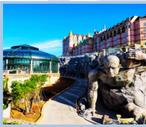
โซน Eclipse Square