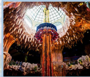
สวนสนุก Fantasy Park