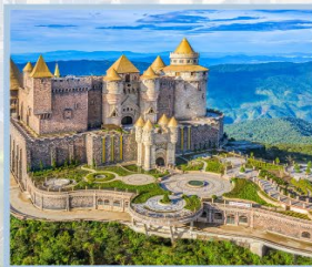
ปราสาทจันตรา