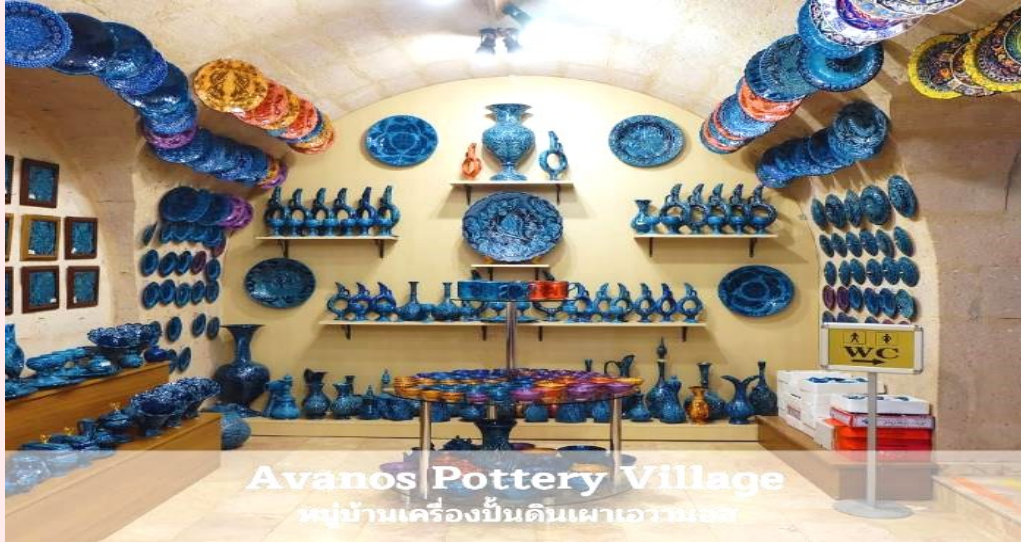
Avanos Pottery Village หมู่บ้านเครื่องปั้นดินเผาเอวานอส

จากนั้นนำท่านเดินทางสู่ เมืองอังการา (ANKARA) เมืองหลวงของประเทศตุรเคีย เมืองที่ใหญ่เป็นอันดับสองรองจากอิสตันบูล มีความสำคัญทั้งทางธุรกิจและอุตสาหกรรม เป็นศูนย์กลางของรัฐบาลตุรเคียและเป็นที่ตั้งของสถานทูตประเทศต่างๆ ศูนย์กลางของการค้าขาย ให้ท่านอิสระพักผ่อนบนรถชมวิวเมือง ระหว่างทางแวะถ่ายรูปทะเลสาบเกลือ (LAKE TUZ) ทะเลสาบที่ใหญ่เป็นอันดับสองในตุรเคียและเป็นหนึ่งในทะเลสาบน้ำเค็มที่ใหญ่ที่สุดในโลก (ใช้เวลาในการเดินทางประมาณ 3.30 ชม.)