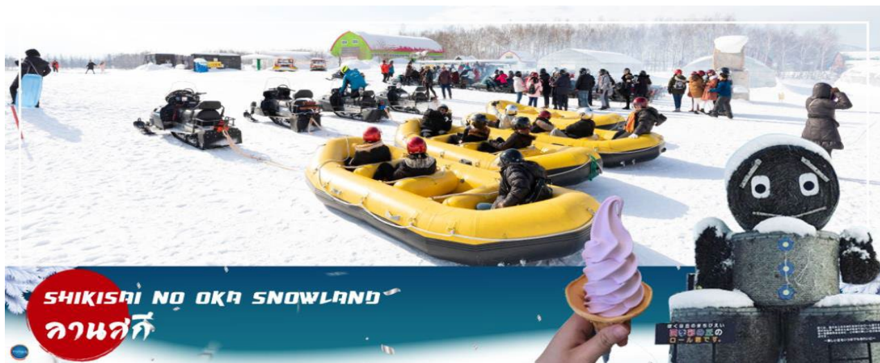
SHIKISAI NO OKA SNOWLAND ลานสกี

นำท่านสู่ ลานสกีชิคิไซพานอรามา (Shikisai no oka) (ใช้เวลาเดินทางประมาณ 1 ชั่วโมง) เนินที่ราบกว้างใหญ่ที่มีโรลคองและโรลจิ้ง เป็นหุบฟางขนาดใหญ่ ซึ่งเป็นสัญลักษณ์ของลานสกีแห่งนี้นี่ ท่านสามารถสนุกสนานกับลานกิจกรรมที่มีบริการอยู่ที่นี่ ทั้งแบบ Snow Raft เรือยางขนาดใหญ่ที่สามารถนั่งเป็นกลุ่ม หรือเดี่ยว ไหลลงจากเนินตามเนินเขาที่กำหนด และยังมี Banana Boat ที่ลากด้วยสโนว์โมบิลที่ลากซิกแซกตามสันเนินสร้างความสนุกสนานตื่นเต้นได้มากเลยทีเดียว และ Sled สำหรับพาหระส่วนตัว ที่ไหลลงจากเนินสูง (*หมายเหตุ ราคาไม่รวมค่าเล่นกิจกรรมต่างๆ ค่าเช่าชุดและอุปกรณ์สกี กรณีลานสกีปิด บริษัทสงวนสิทธิ์ นำลูกค้าไปลานสกีอื่นแทนได้ตามความเหมาะสมกับสถานการณ์)