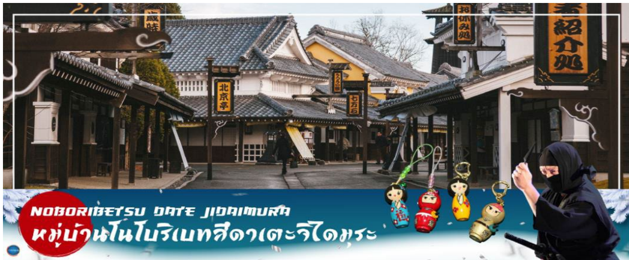
NOBORIBETSU DATE JIDAIMURA หมู่บ้านโนโบริเบะสึดาเตะจิโดมูระ

วันที่ห้า เมืองโนะโบริเบะสึ – หมู่บ้านนินจา ดาเตะจิโดมูระ – เมืองซัปโปโร – มิดซุซึเอะท์เล็ดพาร์ค – ถนนช้อปปิ้งทานุกิโคจิ