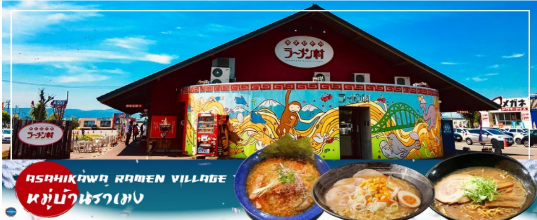
ASAHIKAWA RAMEN VILLAGE หมู่บ้านราเมน

เดินทางสู่ หมู่บ้านราเมนอาซาฮิคาว่า (Asahikawa Village) ที่ราเมนของที่นี่มีรสชาติอันเป็นเอกลักษณ์และได้รับการกล่าวขานถึงความอร่อยยาวนานกว่าทศวรรษ หมู่บ้านราเมนอาซาฮิคาว่า ได้ถือกำเนิดขึ้นในปี 1996 โดยรวบรวมร้านราเมนชื่อดังของเมืองอาซาฮิคาว่าทั้ง 8 ร้านมาอยู่รวมกันเป็นอาคารหลังคาเดียว เสมือน !!ไฮไลท์ หมู่บ้านราเมนที่รวบรวมร้านดังชั้นเทพไว้ในที่เดียว!! และยังมีห้องเล็กๆ ที่จัดแสดงประวัติความเป็นมาขอหมู่บ้านแห่งนี้ให้สำหรับผู้สนใจใฝ่มาศึกษาอีกด้วย ทุกๆ ร้านจะสร้างเอกลักษณ์เฉพาะตัวของร้านตนเองขึ้นมาเพื่อดึงดูดความสนใจของลูกค้า เช่น ร้าน Asahikawa Ramen Aoba ที่แสนภาคภูมิใจในความเป็นราเมนเจ้าที่เก่าแก่ที่สุดในอาซาฮิคาว่า หรือจะเป็นร้าน Ramen Shop Tenkin ที่เชื่อมั่นในน้ำซุปของตัวเองว่าเป็นหนึ่งไม่แพ้ใครที่สำคัญ ราเมน ถือเป็นอาหารเมื่อยอดนิยมของคนญี่ปุ่น เพราะด้วยความที่กินง่ายและมีรสชาติที่หลากหลายจึงเป็นที่ถูกใจของคนญี่ปุ่นทุกเพศทุกวัย