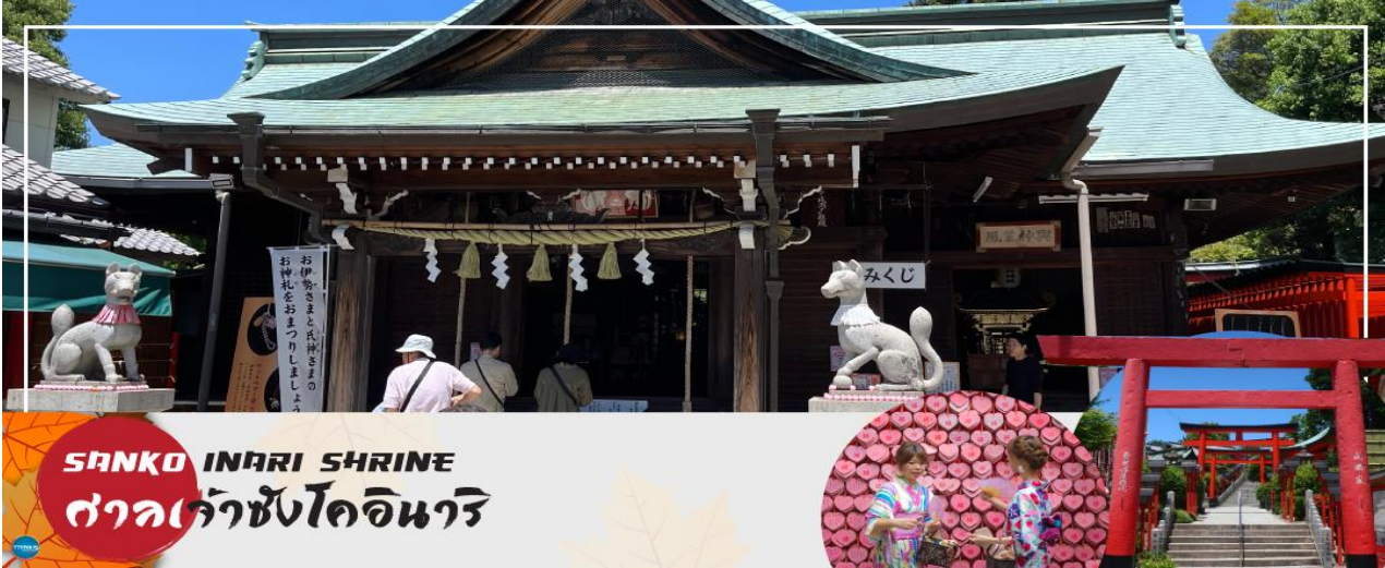
SANKO INARI SHRINE ศาลเจ้าซังโคอินาริ

จากนั้นนำท่านเดินทางสู่ ศาลเจ้าซังโคอินาริ (Sanko Inari Shrine) ตั้งอยู่ใกล้ๆ กับปราสาทอินุยามะ ศาลเจ้านี้มีชื่อเสียงเรื่องความรัก คู่รักมักจะมาขอพรให้มีความสัมพันธ์ที่ดี ชีวิตคู่ราบรื่น ครองรักกันยาวนาน ส่วนคนโสดก็จะขอให้ได้พบเจอคู่แท้จุดเด่นคือเสาโทริอิสีแดงที่เรียงรายสวยงาม และแผ่นป้ายขอพรรูปหัวใจสีชมพู ที่นี้ยังช่วยเรื่องการเงินอีกด้วย ว่ากันว่าถ้านำเงินมาล้างที่ป้อนน้ำศักดิ์สิทธิ์ภายในศาลเจ้า จะช่วยให้เงินนั้นงอกเงยขึ้นหลายเท่า ครอบคลุมวีเจรี่รุ่งเรือง