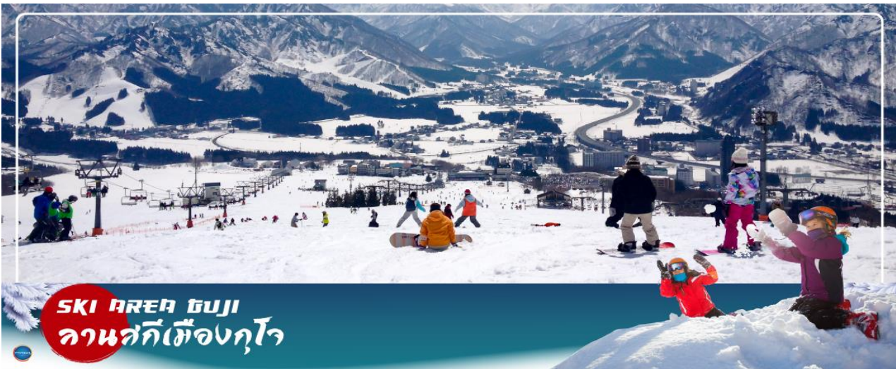
SKI AREA GUJO ลานสกีเมืองกุโจ

วันที่สาม เมืองกุโจซาจิมัง – ลานสกีเมืองกุโจ – เมืองกิฟู – หมู่บ้านมรดกโลกชิราคาวาโกะ – เมืองทาคายามะ – ถนนชั้นมาจิซุจิ – เมืองนาโกย่า