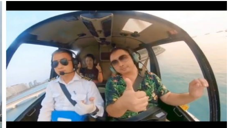
(รวมค่าขึ้นเฮลิคอปเตอร์)

หมายเหตุ*** ใช้เวลาในการนั่งโดยสาร ประมาณ 1 นาทีต่อรอบ และจำกัดผู้โดยสารครั้งละไม่เกิน 3 ท่าน โดยที่มีน้ำหนักรวมทั้งหมดไม่เกิน 200 กก.