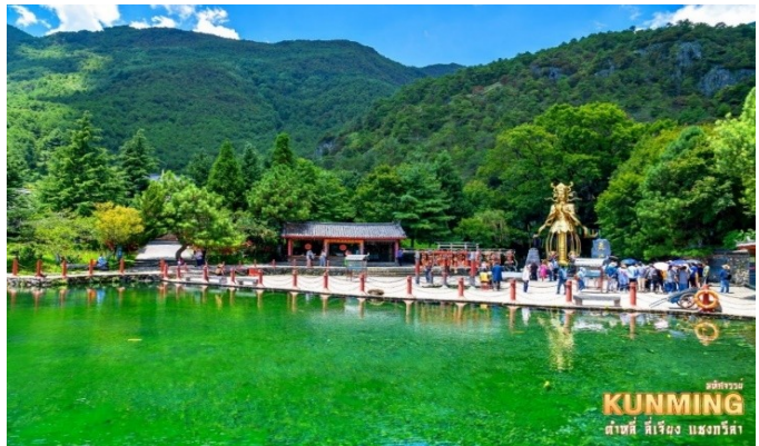
อุทยานน้ำหยก KUNMING ต้าชี่ ลี่เจียง มณฑลยูนนาน

เดินชมหมู่บ้านเล็กๆ ในเมืองลี่เจียง อุทยานน้ำหยก แหล่งท่องเที่ยว ระดับ 4A สถานที่แสดงอัตลักษณ์ ทางด้านวัฒนธรรมของชาวชนเผ่า นาซี โดยออกแบบหมู่บ้านให้มีความ กลมกลืนไปกับสายน้ำไหลลงมาจาก ภูเขาหิมะมังกรหยก ภายในมีวัด ลามะที่เก่าแก่ และสถานที่อัน