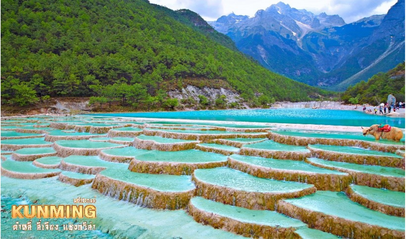
เมืองลี่เจียง KUNMING ต้าชี่ ลี่เจียง มณฑลยูนนาน