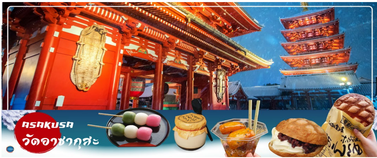
ASAKUSA วัดอาซากุสะ

วันที่ห้า กรุงโตเกียว – วัดอาซากุสะ – ช้อปปิ้งถนนนากามิเซะ – ถ่ายรูปโตเกียวสกายทรีริมแม่น้ำสุมิดะ – พระราชวังอิมพีเรียล(ด้านนอก) – สะพานแวนดา – ย่านโอไดบะ – ห้างไดเวอร์ซิตี