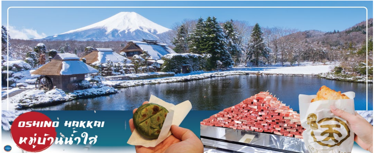
OSHINO HAKKAI หมู่บ้านหัวใจ

เป็นภาพที่สวยงามมาก โอชิโนะฮักไกเป็นหมู่บ้านเล็กๆ ประกอบด้วยบ่อน้ำ 8 บ่อในโอชิโนะ ตั้งอยู่ระหว่างทะเลสาบคาวากูจิโกะ กับทะเลสาบยามานาคาโกะ บ่อน้ำทั้ง 8