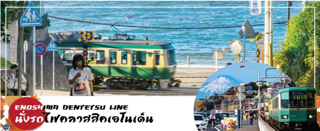
ENOSHIMA DENTETSU LINE นั่งรถไฟคลาสสิกเอโนเด้น