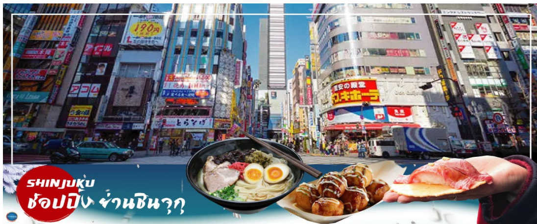
SHINJUKU ช้อปปิ้ง ย่านชินจูกุ

เป็นที่พักที่ อิสระรับประทานอาหารเป็นตามอัธยาศัย ASAKUSA VIEW HOTEL หรือเทียบเท่าระดับเดียวกัน