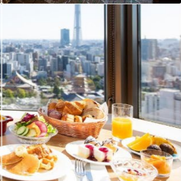
Asakusa View Hotel