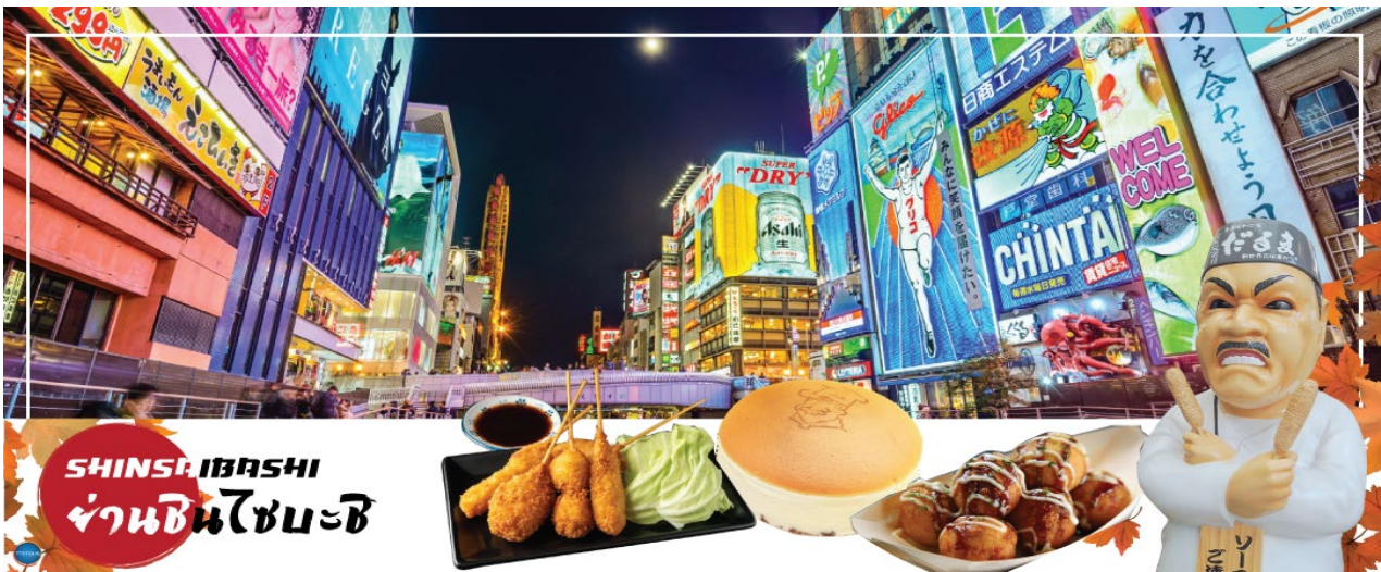
SHINSAIBASHI ย่านชินไซบาชิ

นำทุกท่านเช็คอินจุดถ่ายรูปที่ ศาลเจ้านัมมะยะซากะ (Namba Yasaka Shrine) ตั้งอยู่ในย่านนัมมะของเมืองโอซาก้า ไฮไลท์ของศาลเจ้าแห่งนี้เป็นรูปปั้นหน้าสิงโตอ้าปากขนาดใหญ่ ที่เชื่อกันว่า สามารถสั่นกินปีศาจร้าย หรือ สิ่งไม่ดีทั้งหลาย ให้หายไป และนำพามาซึ่งความโชคดีให้แก่ผู้คน ปัจจุบันนักเรียน นักศึกษา และผู้ประกอบการธุรกิจนั้น นิยมมาขอพรให้ประสบความสำเร็จกันที่นี่ ด้วยความสูง 17 เมตร ความกว้าง 11 เมตรและความลึก 7 เมตร อีสระให้ทุกท่านสักการะ และเก็บภาพที่ ศาลเจ้านัมมะ ยะซากะ