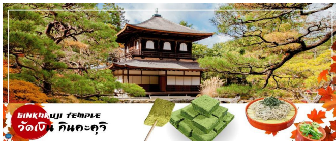
GINKAKUJI TEMPLE วัดเงิน กินคะคุจิ

นำท่านสู่ วัดกินคะคุจิ (Ginkakuji Temple) หรือ วัดเงิน เป็นอีกหนึ่งในสถานที่ที่ขึ้นทะเบียนกับองค์การยูเนสโกให้เป็นมรดกโลกด้านวัฒนธรรม ซึ่งวัดกินคะคุจิเป็นวัดนิกายเซน ถูกสร้างขึ้นโดยโชกุนอชิคากะ โยชิมาสะ หลานชายของท่านโชกุน ที่สร้างวัดกินคะคุจิ (Ginkakuji Temple) หรือที่รู้จักกันอย่างกว้างขวางว่าวัดทองสำหรับอาคารของวัดเงินสร้างขึ้นในรูปแบบเดียวกัน เพียงแต่จะไม่ได้มีสีทอง เป็นอาคาร 2 ชั้น และมีนกฟีนิกซ์อยู่บนหลังคาอาคารเช่นเดียวกัน อาณาบริเวณของวัดซึ่งอยู่บนเขายังคงสภาพความเป็นธรรมชาติป่าอย่างสมบูรณ์แบบ มีต้นไม้บานาพรรณ ในแบบสวนญี่ปุ่น เต็มไปด้วยความชุ่มชื้นเย็นสบาย