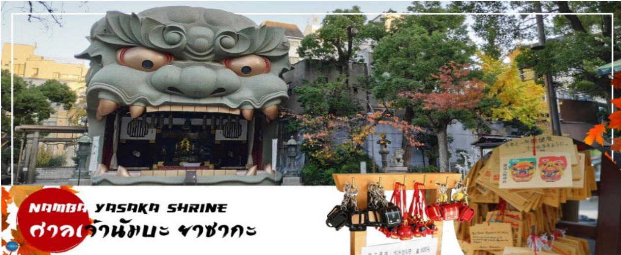
NAMBA YASAKA SHRINE ศาลเจ้านัมมะยะซากะ

เดินทางสู่ เมืองโอซาก้า (Osaka) (ใช้เวลาเดินทางประมาณ 1 ชั่วโมง) เมืองที่มีขนาดเศรษฐกิจใหญ่เป็นอันดับ 2 และมีประชากรมากเป็นอันดับ 3 ของประเทศญี่ปุ่น ตั้งอยู่ในภาคคันไซบนเกาะฮนชู ประเทศญี่ปุ่น ปัจจุบันเมืองโอซาก้ามีสถานที่ท่องเที่ยวมากมาย มีแหล่งช้อปปิ้งยอดนิยม มีสวนสนุกขนาดใหญ่ ทั้งยังมีอาหารที่เป็นเอกลักษณ์ เช่น ทาโกะยากิ โอโคโนมียากิ (พิซซ่าญี่ปุ่น) และ คิวคัตตลี