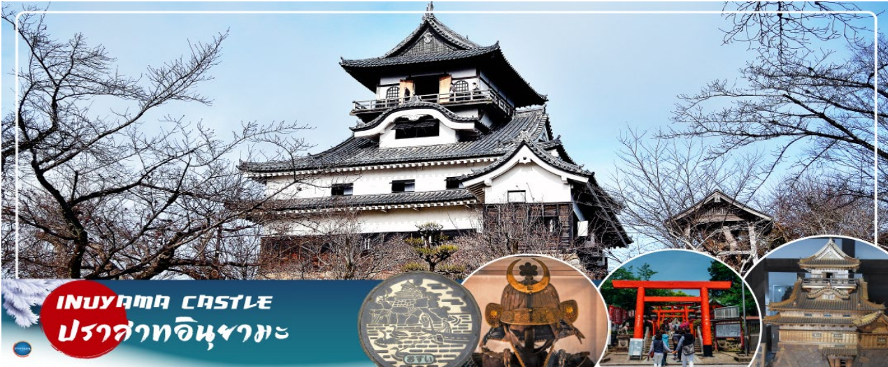
INUYAMA CASTLE ปราสาทอินูยามะ

จากนั้นเดินทางสู่ เมืองอินูยามะ (Inuyama) (ใช้เวลาเดินทางประมาณ 1.30 ชั่วโมง) จังหวัดไอจิ (Aichi) มีสถานที่ท่องเที่ยวชื่อดังหลายแห่ง ที่ขึ้นชื่ออย่างมาก นำท่านสัมผัสบรรยากาศความเป็นญี่ปุ่นที่หาได้เฉพาะในเมืองอินูยามะ