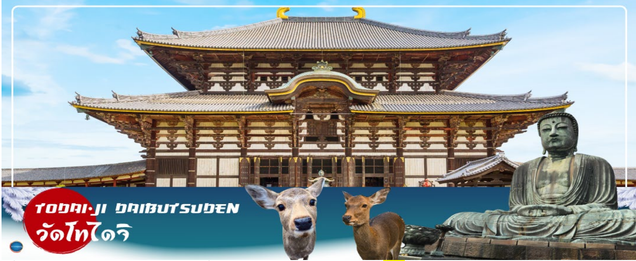
TODAI-JI DAIBUTSU DEN วัดโทไดจิ