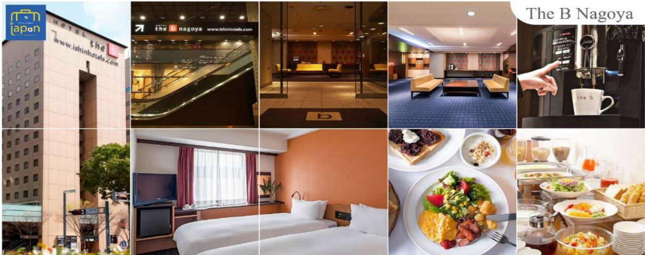
The B Nagoya

เย็นที่พัก อีสาระรับประทานอาหารเย็นตามอัธยาศัย THE B NAGOYA หรือเทียบเท่าระดับเดียวกัน