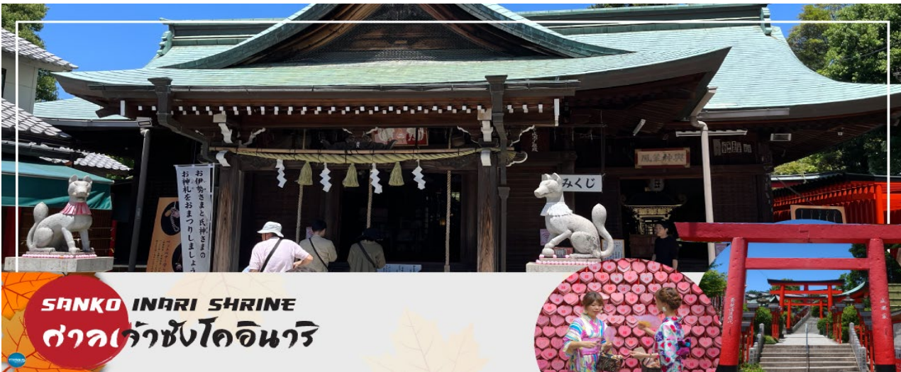
SANKO INARI SHRINE ศาลเจ้าซังโคอินาริ

จากนั้นนำท่านเดินทางสู่ ศาลเจ้าซังโคอินาริ (Sanko Inari Shrine) ตั้งอยู่ใกล้ๆ กับปราสาทอินูยามะ ศาลเจ้านี้มีชื่อเสียงเรื่องความรัก คู่รักมักจะมาขอพรให้มีความสัมพันธ์ที่ดี ชีวิตคู่ราบรื่น ครอบครัวยาวนาน ส่วนคนโสดก็จะขอให้ได้พบเจอคู่แท้จุดเด่นคือเสาโทริอิสีแดงที่เรียงรายสวยงาม และแผ่นป้ายขอพรรูปหัวใจสีชมพู ที่นี้ยังช่วยเรื่องการเงินอีกด้วย ว่ากันว่าถ้านำเงินมาล้างที่บ่อน้ำศักดิ์สิทธิ์ภายในศาลเจ้า จะช่วยให้เงินนั้นงอกเงยขึ้นหลายเท่า ครอบครัวยุคใหม่