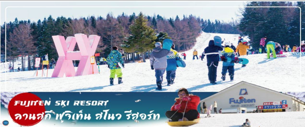
FUJITEN SKI RESORT

สัมผัสหิมะ ณ ลานสกี ฟุจิเท็น สโนว รีสอร์ท หรือ จุดชมวิวชั้น 5 ภูเขาไฟฟูจิ (ขึ้นอยู่กับสภาพ อากาศ) – พิธีชงชาญี่ปุ่น – กรุงโตเกียว – ชมแมวยักษ์ 3 มิติ พร้อมช้อปปิ้ง ย่านชินจูกุ – เมืองนาริตะ