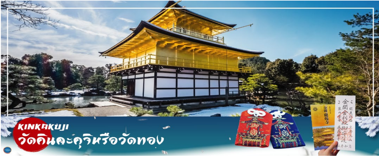
KINKAKUJI วัดคินคะคุจิหรือวัดทอง

เมืองโอซาก้า – เมืองเกียวโต – วัดคินคะคุจิ – การเรียนพิธีชงชาญี่ปุ่น อาราชิยาม่า – สวนป่าไผ่ – สะพานโทเกดส์เคียว – เมืองโอซาก้า – ซัปโปริงชินไซบาชิ