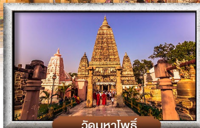
วัดมหาโพธิ์