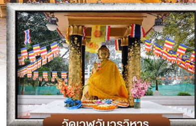
วัดเวฬุวันวิหาร