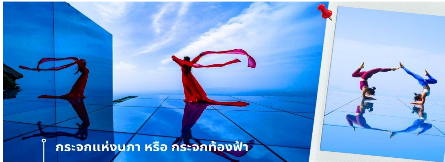
กะจกแห่งนภา หรือ กะจกท้องฟ้า

จากนั้นพาท่านถ่ายภาพความสวยงามของหุบเขาหลิงซาน ในจุดชมวิวและถ่ายภาพที่ได้รับความนิยมจากนักท่องเที่ยวจำนวนมาก นั่นคือ กะจกแห่งนภา หรือ กะจกท้องฟ้า เป็นจุดที่ท่านจะได้ เก็บภาพประทับใจของหุบเขาหลิงซานในมุมที่แปลกตา และน่าตื่นตึ่ง ด้วยมีลักษณะที่เป็นกะจกเงาสะท้อนตัดกับเส้นขอบฟ้า และภูเขา ถึงทำให้เกิดภาพที่น่ามหัศจรรย์