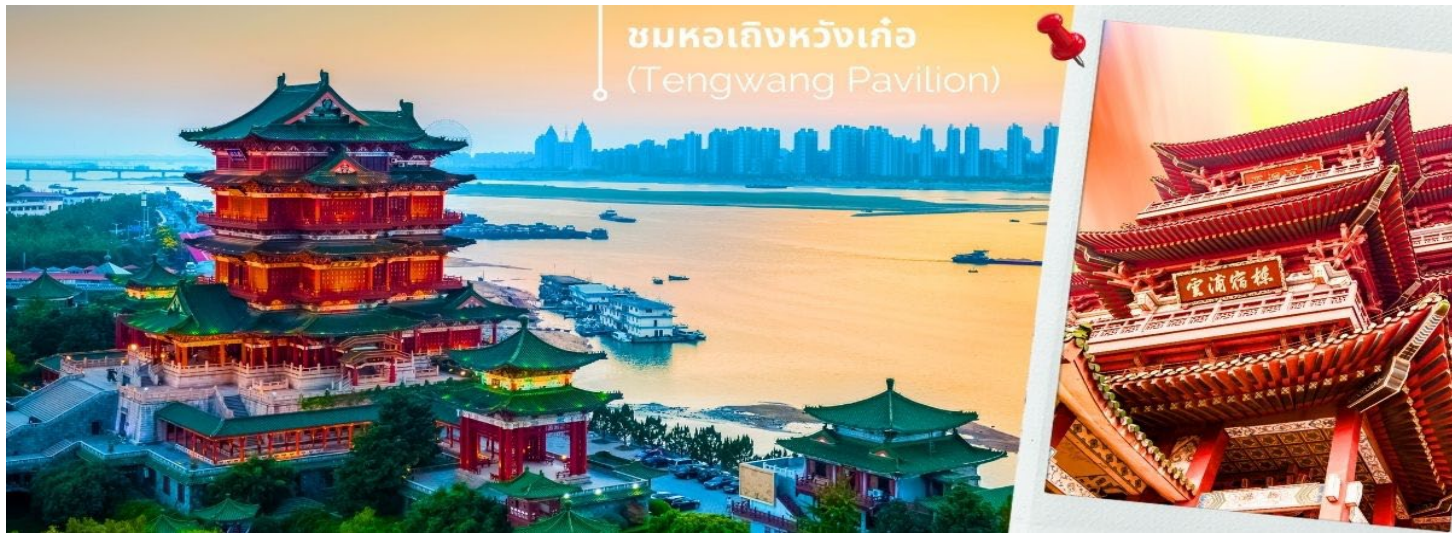
ชมหอเลิงหวังเก้อ (Tengwang Pavilion)

มาในปี 1995 เทศบาลหนานชางจึงทำการสร้างใหม่เป็นตึกคอนกรีตโดยที่ ตึกนี้มีด้วยกัน 9 ชั้น ภายในตกแต่งด้วย บทกวีและภาพฝาผนังสมัยราชวงศ์ถังและอื่นๆ 1 ใน 3 หอที่มีชื่อเสียงที่สุดในเมืองจินฮอสูง 9 ชั้น ริมฝั่งแม่น้ำกัน