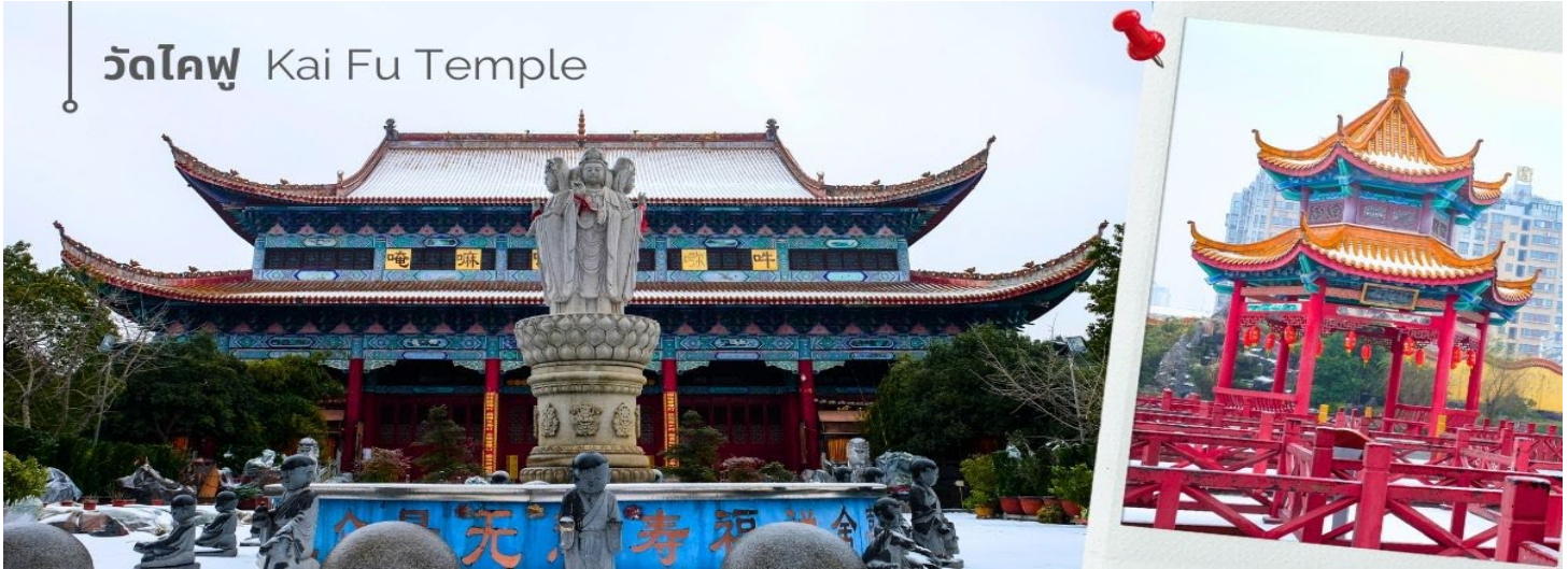
วัดไคฟู Kai Fu Temple

นำท่านชม วัดไคฟู วัดพุทธนิกายเซนเก่าแก่ ประจำเมืองฉางซา สร้างขึ้นในสมัยราชวงศ์ถัง มีอายุกว่า 1,300 ปี ภายในวัดมีสถาปัตยกรรมสไตล์จีนโบราณ ประติมากรรม และภาพจิตรกรรมฝาผนัง สามารถมาชมความสวยงามของสถาปัตยกรรม เรียนรู้วัฒนธรรม และกราบไหว้พระ ขอพรได้ บรรยากาศโดยรอบมีต้นไม้ สระน้ำ ช่วยเพิ่มความร่มรื่น มีความเงียบสงบ เหมาะแก่การมาเดินเล่นพักผ่อนหย่อนใจ