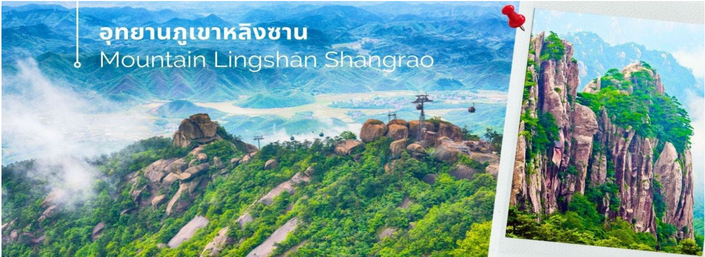
อุทยานภูเขาหลิงซาน Mountain Lingshan Shangrao

นำท่านเดินทางสู่ อุทยานภูเขาหลิงซาน ตั้งอยู่ทางตอนเหนือของประเทศจีน มณฑลช่างเหรา มีพื้นที่สวยงาม 160 ตารางกิโลเมตร หลิงซานถูกระบุว่าเป็น "หนึ่งใน 33 สถานที่ศักดิ์สิทธิ์ของโลก" โดยหนังสือลัทธิเต๋า เมื่ออากาศแจ่มใสและทัศนวิสัยดี คุณจะเห็นรูปลักษณ์ที่สวยงามและตั้งตรงของภูเขาหลิงซาน มีความเก่าแก่และมีมนต์ขลังมาก ไม่เพียงแต่มีภูมิทัศน์ที่สวยงาม แต่ยังมีตำนานที่ยาวนานอีกมากมาย เป็นส่วนหนึ่งของภูเขา Huaiyu ภูเขาหินสูงชัน และคดเคี้ยวไปทางทิศตะวันตกจนกระทั่งถึงภูเขาไป๋หยุนเฟิง และแบ่งออกเป็นสองส่วน ส่วนหนึ่งไปทางเหนือและอีกส่วนหนึ่งไปทางทิศตะวันตก เหมือนพระจันทร์เสี้ยวที่ฝังอยู่ในดินแดนทางตะวันออกเฉียงเหนือของมณฑลเจียงซี