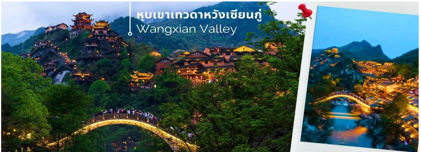
หุบเขาเทวดาหวังเซียนกู่ Wangxian Valley

จากนั้นออกเดินทางสู่ เมืองชางเหรา นำท่านชม หุบเขาเทวดาหวังเซียนกู่ หมู่บ้านวังเซียน หรือหุบเขาเทวดา สิ่งมหัศจรรย์ที่ถูกสร้างขึ้นมาด้วยธรรมชาติและมือของมนุษย์ เป็นหมู่บ้านที่มีประวัติความเป็นมายาวนานกว่าพันปี หมู่บ้านวังเซียนกู่ มีมาตั้งแต่สมัยราชวงศ์ฮั่นราวๆปี ค.ศ. 220 เป็นช่วงเริ่มต้นของยุคสามก๊ก ก็คือ จ๊กก๊ก วูยก๊ก และง่อก๊ก ที่นี้เคยเป็นที่อยู่อาศัยของเหล่าเทพหรือนักบุญเลยเป็นชื่อที่หลายคนขนานนามว่าเป็น “บ้านเกิดของผู้เป็นอมตะ” หรือ “หุบเขาเทวดา” นั่นเอง ซึ่งเอกลักษณ์ความสวยงามของที่นี่ เป็นเหมือนสิ่งที่เหมาะผสานระหว่างความสวยงามของธรรมชาติ กับอาคารบ้านเรือนของวัฒนธรรมจีนได้อย่างลงตัว ไม่แปลกเลยที่ที่นี่จะถูกจัดให้เป็นสถานที่ท่องเที่ยวระดับ 4A และในปี 2022 หวังเซียนกู่ก็ติดอันดับ 1 ใน 10 จุดชมวิวที่คนจีนในแอปพ Douyin อยากมาเที่ยวกันมากที่สุด ช่วงเวลากลางคืน แสงไฟที่จัดแสดงได้เพิ่มความอลังการ ให้กับหมู่บ้านวังเซียนกู่มากขึ้นไปอีก