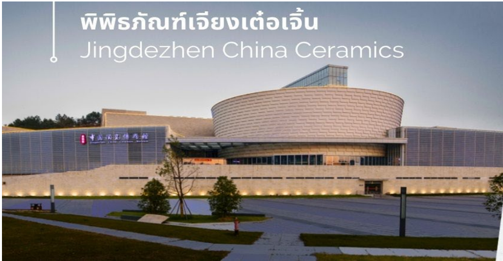
พิพิธภัณฑ์เจียงเต๋อเจิ้น Jingdezhen China Ceramics

นำท่านชม พิพิธภัณฑ์ Jingdezhen China Ceramics เดิมชื่อ Jingdezhen Ceramics Museum เป็นพิพิธภัณฑ์ศิลปะเซรามิกขนาดใหญ่แห่งแรกในจีน เนื้อหาพิพิธภัณฑ์แบ่งออกเป็น “แผนกประวัติศาสตร์” “แผนกจีนใหม่” และห้องนิทรรศการพิเศษ เป็นที่รวบรวมผลงานเซรามิกที่มีชื่อเสียงจากยุคประวัติศาสตร์ที่แตกต่างกันมากกว่า 20,000 ชิ้น ตั้งแต่ยุคหินใหม่ ราชวงศ์ฮั่นและถึง รวมถึงโบราณวัตถุทางวัฒนธรรมอันล้ำค่าของชาติมากกว่า 500 ชิ้น ครอบคลุมประวัติศาสตร์พันปี