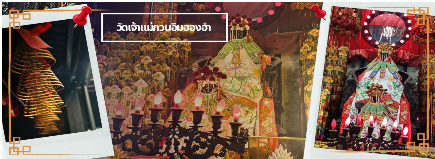
วัดเจ้าแม่กวนอิมสองอ้า

จากนั้นนำท่านชม โรงงานจิวเวอรี ซึ่งเป็นโรงงานที่มีชื่อเสียงที่สุดของฮ่องกงในเรื่องการออกแบบเครื่องประดับ อาทิเช่น จี้ และแหวนกำหั้น ที่สวยงามโดดเด่นไม่เหมือนใคร ซึ่งถือกำเนิดขึ้นที่นี่และมีชื่อเสียงที่สุดใช้เป็นเครื่องประดับติดตัว และเสริมดวงชะตา สินค้าทุกชิ้นมีเอกสารรับประกันคุณภาพเปลี่ยน ซ่อม ได้ตลอดอายุการใช้งาน หากเกิดการชำรุดจากสินค้าไม่ใช่อุบัติเหตุ