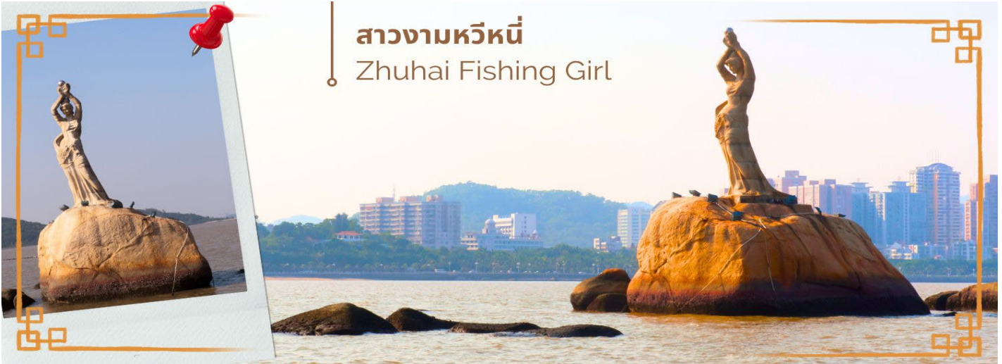
สาวงามหวีหน้ Zhuhai Fishing Girl

จากนั้นนำท่านสู่ ร้านหยก หยกในจินโบราณจนมาถึงสมัยนี้ ยังมีความเชื่อว่าเป็นอัญมณีที่ล้ำค่าและหายาก บ่งบอกฐานะของสตรีในสมัยก่อน แต่ในสมัยนี้ เชื่อกันว่าหยกสีเขียวนั้นเหนี่ยวนำโชคและความร่ำรวย ดังคำกล่าวที่ว่า“สีเขียวเหนี่ยวทรัพย์” ถือเป็นการเสริมดวงจัญที่ดีของผู้สวมใส่อัสระให้ท่านได้เรียนรู้ชนิดของหยกและเลือกซื้อตามใจชอบจากนั้นนำท่านสู่ สวนหยวนหมิง หรือ พระราชวังจำลองหยวนหมิง ตั้งอยู่ ณ ใจกลางหุบเขาชิลิน เมืองจูไห่ สร้างขึ้นเลียนแบบพระราชวังหยวนหมิง ณ กรุงปักกิ่ง สิ่งก่อสร้างต่างๆ มากกว่า 100 ชิ้น มีขนาดเท่าของจริงในอดีตทุกชิ้น อาทิ เสาหินคู่ สะพานข้ามธารทอง ประตูต่ากง ตำนกเจิ้งต่ากวางหมิง สะพานเก้าเหลี่ยม สวนแห่งนี้โอบล้อมด้วยขุนเขาที่เขียวชอุ่ม และมีพื้นที่ครอบคลุมทะเลสาบขนาดมหึมา ซึ่งมีขนาดเท่ากับสวนเดิมในกรุงปักกิ่ง และยังมีการเพิ่มเติมและตกแต่งสวนที่เป็นศิลปะแบบตะวันตกผสมกับศิลปะจีน