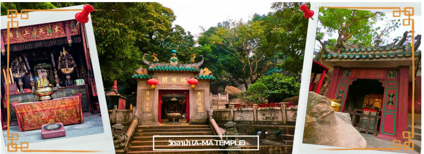
วัดอาม่า (A-MA TEMPLE)

จากนั้นนำท่านสู่ วัดอาม่า (A MA TEMPLE) หนึ่งในวัดสำคัญ ศักดิ์สิทธิ์ และเก่าแก่ที่สุดของมาเก๊า คนไทยคุ้นหูในชื่อ ศาลเจ้าแม่ทับทิม โด่งดังในการขอพรเรื่องหน้าที่การงาน การเงิน และความเป็นสิริมงคลแก่ชีวิต ใครที่ไปกราบไหว้ บูชา กลับมาชีวิตในการทำงาน การเงินก็จะดีขึ้น มีเทพศักดิ์สิทธิ์องค์ต่างๆ ซึ่งผสมผสานความเชื่อทางพุทธศาสนา ลัทธิเต๋า คติความเชื่อพื้นบ้าน วัฒนธรรมประเพณี และความศรัทธา โดยตัววัดมีความเก่าแก่อย่างมาก ทำให้มีคุณค่าทางประวัติศาสตร์ จึงทำให้วัดแห่งนี้ กลายเป็นหนึ่งในสถานที่ ที่กำหนดไว้ในศูนย์ประวัติศาสตร์แห่งมาเก๊า แต่เดิมเชื่อกันว่าที่มาของชื่อ มาเก๊า มาจากบริเวณวัดอาม่าแห่งนี้เอง โดยในอดีตจะมีอ่าวที่ชื่อว่า อาม่า ก๊อก แปลว่า อ่าวของอาม่า จึงเพี้ยนมาเป็นชื่อ มาเก๊า ในปัจจุบันนั่นเอง ต่อมาในปี 2005 วัดอาม่า มาเก๊า ได้รับการขึ้นทะเบียนให้เป็นมรดกโลกโดย UNESCO ซึ่งตัววัดเองมีตำนานเล่าว่า มีเด็กสาวชื่อว่า หลินโม ซึ่งเป็นเด็กที่เฉลียวฉลาด สามารถยังรู้ถึงความเจ็บไข้ได้ป่วยของผู้อื่น อยู่มาวันหนึ่ง หลินโม มีความคิดอยากจะทำมายังคาบสมุทรฮั่วเหมิน จึงขอตีตเรือไปกับคนอื่นที่อยากจะทำมายังด้วยกัน แต่มีเหตุการณ์ไม่คาดคิด เกิดพายุโหมกระหน่ำ ทำให้เรือหลายลำที่เดินทางไปด้วย กันจมลงสู่ใต้ท้องทะเล ยกเว้นเรือที่มีหลินโม จนทำให้สามารถที่เดินทางถึงฝั่งได้โดยสวัสดิภาพ และต่อมาเธอก็ได้มาเสียชีวิตลงบริเวณอ่าว A Ma วิญญาณของเธอก็มักจะ