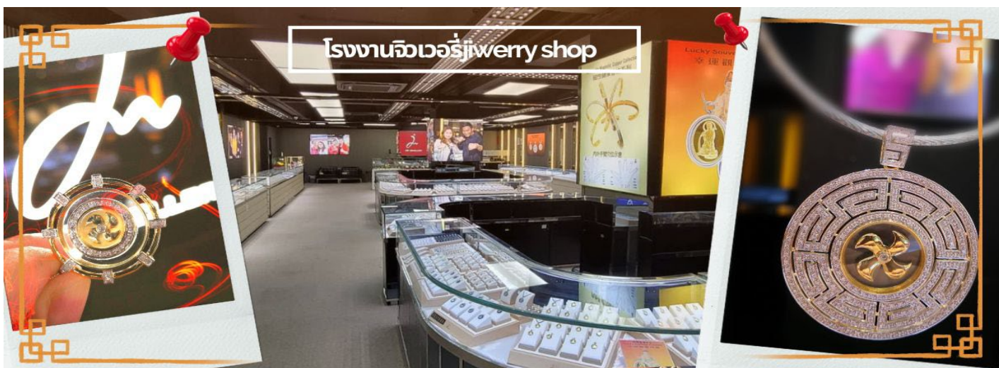
โรงงานจิวเวอรี jewelry shop

จากนั้นนำท่านเดินทางไป วัดแชกงหมิว หรือ วัดกังหัน (CHE KUNG TEMPLE) วัดแชกงสร้างขึ้นเพื่อเป็นอนุสรณ์เพื่อรำลึกถึงตำนานแห่งนักรบราชวงศ์ซ่ง มีนามว่า “แช กง” แม่ทัพปราบศึก ผู้คนทั่วทุกดินแดนต่างยำเกรงในกำลังพลอันกล้าหาญแข็งแกร่งของแม่ทัพแชกง เป็นวัดเก่าแก่ที่มีความศักดิ์สิทธิ์มาก มีอายุกว่า 300 ปี ตั้งอยู่ในเขต SHATIN มีประวัติเล่าต่อกันมาว่า ขณะที่แม่ทัพปราบศึกอยู่นั้น ทุกแคว้นเขตแดนแผ่นดินใหญ่ต่างก็ยำเกรงต่อกำลังพลที่กล้าหาญในกองทัพของท่าน ยามที่ออกรบเพื่อต้านข้าศึกศัตรูทุกทิศทาง ทุก ๆ ครั้งท่านใช้สัญลักษณ์รูปกังหัน 4 ใบพัดติดไว้ด้านหน้ารถศึกนำขบวนในกองทัพ เหล่าทหารกล้ามีความเชื่อว่าเมื่อพก