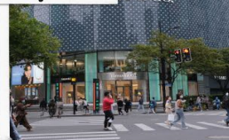
ถนนคนเดินหวยไห่