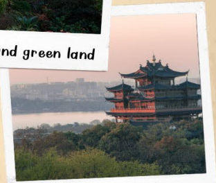
หอเจิ้งหวงเก้อ