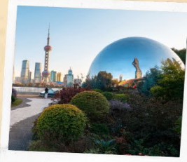
North bund green land