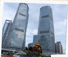
ย่านลู่เจียจู่