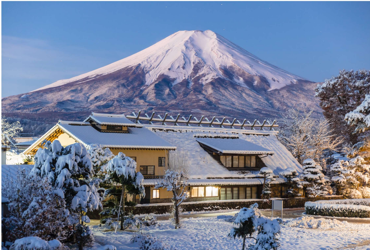
T2G-KIXHND03TG Osaka Tokyo Disneyland...โอซาก้า ชิราคาวาโกะ ฟุจิ โตเกียว ดิสนีย์แลนด์ 7D 4N (TG)