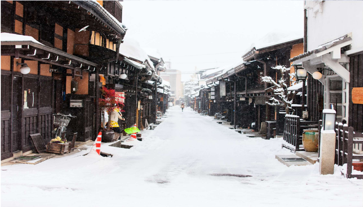
T2G-KIXHND03TG Osaka Tokyo Disneyland...โอซาก้า ชิราคาวาโกะ ฟุจิ โตเกียว ดิสนีย์แลนด์ 7D 4N (TG)