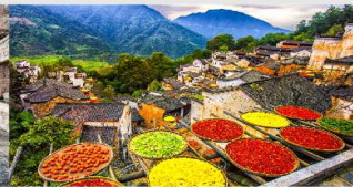
หมู่บ้านหวงหลิง