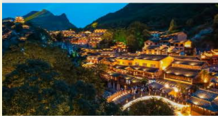
หุบเขาเทวดาวิ่งเซียนถู่