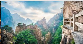
เขาหวงซาน