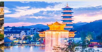
ล่องเรืออู๋หนี่โจว

*ทางบริษัทฯ ขอสงวนสิทธิ์ในการสลับโปรแกรมทัวร์ตามความเหมาะสมขึ้นอยู่กับสถานการณ์หน้างาน โดยคำนึงถึงผลประโยชน์ของลูกค้าเป็นสำคัญ