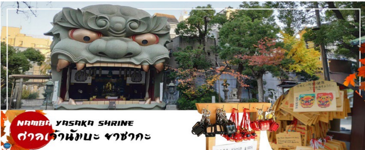
NAMBA YASAKA SHRINE ศาลเจ้านัมบะ ยะชะกะ

นำทุกท่านเช็คอินจุดถ่ายรูปที่ ศาลเจ้านัมบะ ยามากะ (Namba Yasaka Shrine) ตั้งอยู่ในย่านนัมบะของเมืองโอซาก้า ไฮไลท์ของศาลเจ้าแห่งนี้ คือรูปปั้นหน้าสิงโตอ้าปากขนาดใหญ่ ที่เชื่อกันว่า สามารถกลืนกินปีศาจร้าย หรือ สิ่งไม่ดีทั้งหลาย ให้หายไป และนำพามาซึ่งความโชคดีให้แก่ผู้คน ปัจจุบันนักเรียน นักศึกษา และผู้ประกอบการธุรกิจนั้น นิยมมาขอพรให้ประสบความสำเร็จกันที่นี่ ด้วยความสูง 17 เมตร ความกว้าง 11 เมตรและความลึก 7 เมตร อีสระให้ทุกท่านสักการะ และเก็บภาพที่ ศาลเจ้านัมบะ ยะชะกะ