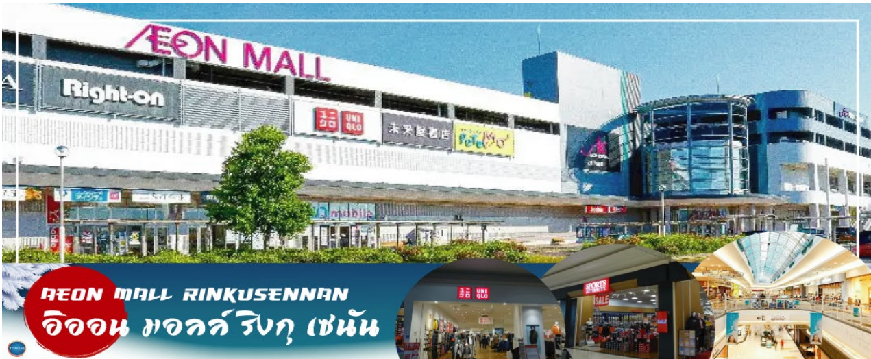
AEON MALL RINKUSENAN อ็อน มอลล์ ริงกุ เซ็นัน

นำท่านสู่ ห้างอ็อน มอลล์ ริงกุ เซ็นัน (AEON MALL RINKUSENAN)" (ใช้เวลาเดินทางประมาณ 1 ชั่วโมง) จากห้างสามารถมองเห็นทิวทัศน์ของอ่าวโอซาก้า ความงามของพระอาทิตย์ตกดินที่นี่ถูกเลือกให้เป็น 100 สถานที่ชมพระอาทิตย์ตกดินที่ดีที่สุดของญี่ปุ่น นอกจากนี้ยังมีจอร์จฟรี่