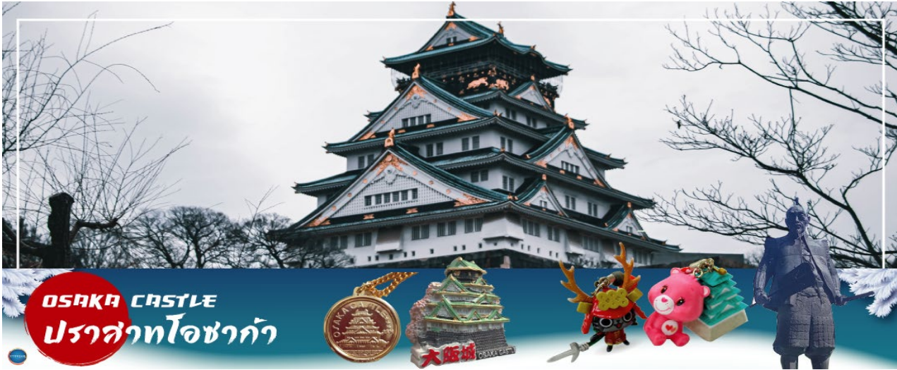
OSAKA CASTLE ปราสาทโอซาก้า