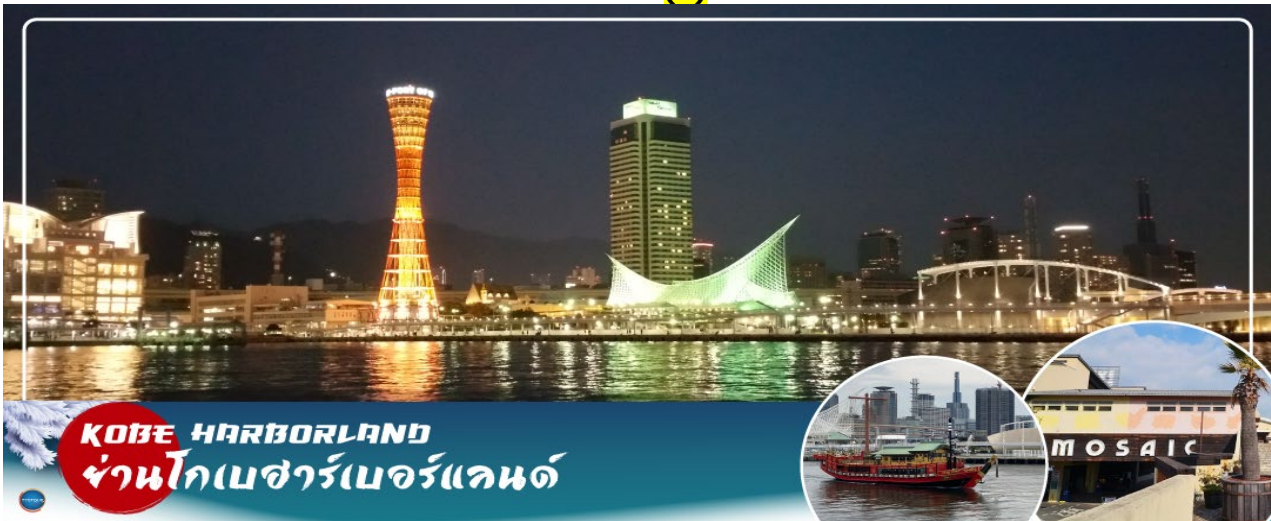
KOBE HARBORLAND ย่านโกเบซาร์เบอร์แลนด์

นำท่านสู่ ย่านโกเบซาร์เบอร์แลนด์(Kobe Harborland) (ใช้เวลาเดินทางประมาณ 1 ชั่วโมง) ตั้งอยู่ที่บริเวณท่าเรือโกเบ นับเป็นย่านที่รวมทั้งแหล่งช้อปปิ้งและความบันเทิงที่หลากหลายที่โด่งดังมากของเมืองแห่งนี้เพราะมีทั้งร้านค้าแฟร์ ร้านอาหาร ร้านค้า และสวนสนุก ซึ่งเป็นจุดนัดพบที่นิยม