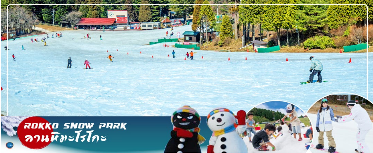
ROKKO SNOW PARK ลานหิมะโรโกะ