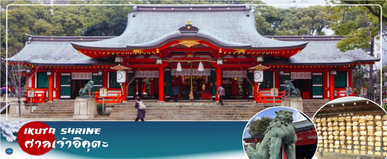
IKUTA SHRINE ศาลเจ้าอิคุตะ

จากนั้นนำท่านสักการะ ศาลเจ้าอิคุตะ (Ikuta Shrine) ตั้งอยู่ในย่านใจกลางเมืองซันโนะมียะ (Sannomiya) เป็นศาลเจ้าที่มีประวัติศาสตร์ยาวนาน ก่อตั้งในปี 201 หนึ่งในสามศาลเจ้าหลักของ โกเบที่มีประวัติศาสตร์ยาวนานกว่า 1,800 ปี ทางเหนือไปตามถนนช็องถนนอิคุตะ คุณจะเห็นทางเข้า ศาลเจ้าพร้อมประตูโทริอิที่สร้างโดยใช้วัสดุรีไซเคิลจากศาลเจ้าใหญ่อิเสะ ศาลเจ้าอิคุตะมีชื่อเสียงใน ด้านผลประโยชน์ในการจับคู่ เนื่องจากจิตอาหิ อนุชนเป็นเทพเจ้าผู้ทอเสื้อผ้าของเทพเจ้า และเธอ ทอด้ายและด้ายเข้าด้วยกัน คนในพื้นที่เรียกกันอย่างเสนาหว่า "อิคุตะซัง"