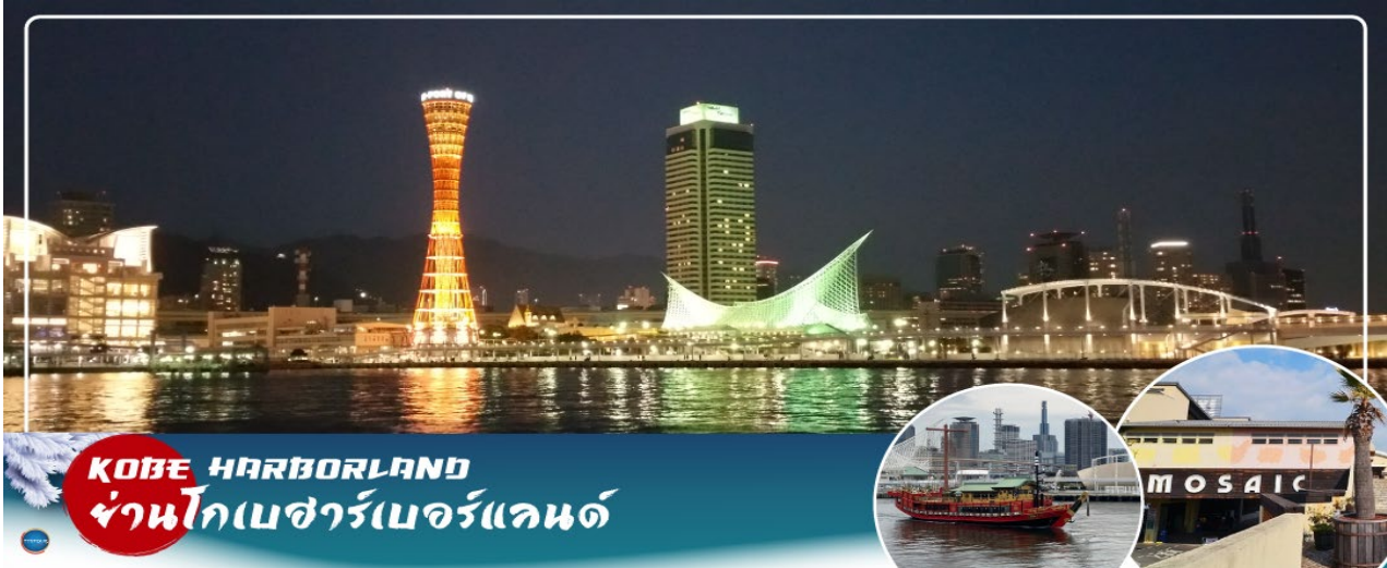
KOBE HARBORLAND ย่านโกเบซาร์เบอร์แลนด์

นำท่านสู่ ย่านโกเบซาร์เบอร์แลนด์(Kobe Harborland) (ใช้เวลาเดินทางประมาณ 1 ชั่วโมง) ตั้งอยู่ที่บริเวณท่าเรือโกเบ นับเป็นย่านที่รวมทั้งแหล่งช้อปปิ้งและความบันเทิงที่หลากหลายที่โด่งดังมากของเมืองแห่งนี้เพราะมีทั้งร้านค้าแฟ ร้านอาหาร ร้านค้า และสวนสนุก ซึ่งเป็นจุดนัดพบที่นิยม