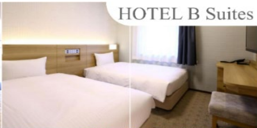
HOTEL B Suites