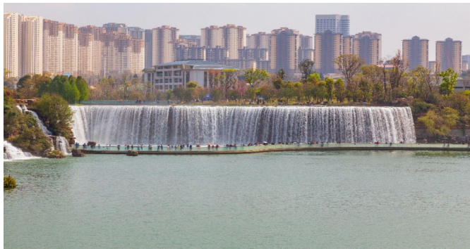
เลยที่เดียว

นำท่านเดินทางสู่ สวนน้ำตกคุนหมิง สวนสาธารณะใจกลางเมืองคุนหมิงแห่งนี้เปิดให้ใช้บริการเมื่อปี 2016 ถือเป็นสถานที่ท่องเที่ยวแห่งใหม่และเป็นที่พักผ่อนหย่อนใจยอดฮิตของชาวเมืองคุนหมิงเลยทีเดียว Kunming Waterfall Park หรืออีกชื่อหนึ่งคือ Niulan River Waterfall Park เป็นสวนสาธารณะขนาดใหญ่ที่ใช้เวลาสร้างกว่า 3 ปี ภายในประกอบไปด้วยน้ำตกและทะเลสาบอีก 2 แห่ง ที่สร้างขึ้นด้วยฝีมือมนุษย์ไฮไลต์ของสวนอย่าง น้ำตกใหญ่ยักษ์นั้น กว้างกว่า 400 เมตร และมีความสูงถึง 12.5 เมตร ถือเป็นน้ำตกฝีมือมนุษย์ที่ยาวติดอันดับของเอเชีย