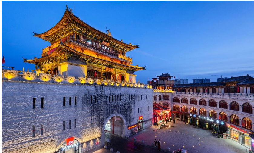
**อิสระรับประทานอาหารค่ำ ณ ถนนคนเดินลี่จินเหมิน**