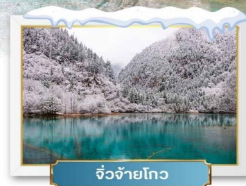
จิวจ้ายโกว