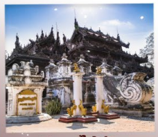
วิหารไม้สัก ชเวตทานจอง