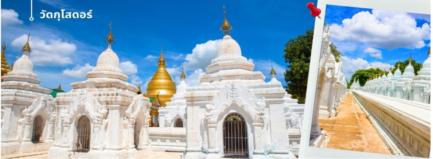
วัดกุโสดอร์

จากนั้นนำท่านชมทัศนียภาพของเมืองที่ ภูเขาฆัณฑะเลย์ฮิลล์ (Mandalay hills) ตั้งอยู่ทางตะวันออกเฉียงเหนือจากใจกลาง เมืองฆัณฑะเลย์ ชื่อเมืองตั้งตามชื่อของเนินเขา ภูเขาฆัณฑะเลย์ขึ้นชื่อเรื่องเจดีย์และอารามมากมาย และเป็นสถานที่จาริกแสวงบุญ