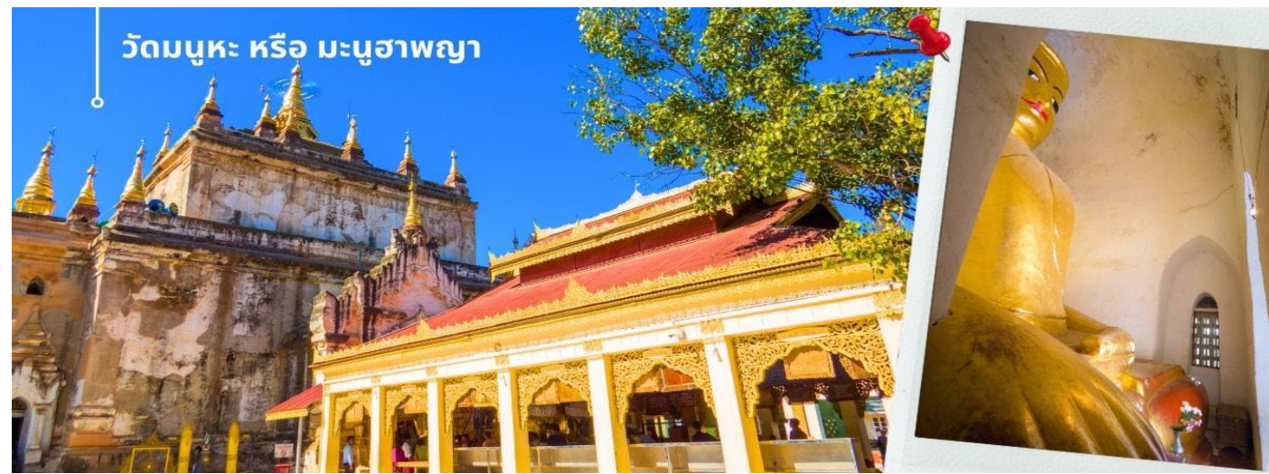
วัดมธุระ หรือ มะนุชาพญา

จากนั้นนำท่านชม วัดมธุระ หรือ มะนุชาพญา เป็นวัดและโบราณสถานี่สร้างโดยพระเจ้ามธุระ กษัตริย์มอญแห่งอาณาจักรสุธรรมวดี ขณะที่พระองค์ทรงถูกจองจำในเมืองพุกามในรัชสมัยพระเจ้าโนรธามังช่อ ปัจจุบันตั้งอยู่ในเขตมณฑลเยล ประเทศพม่าตามประวัติได้เล่าว่าพระเจ้าโนรธามังช่อ กษัตริย์พุกาม ได้ทรงทำสงครามกับอาณาจักรสุธรรมวดี เมืองหลวงของมอญและได้รับชัยชนะ จึงทรงกวาดต้อนกษัตริย์แห่งสุธรรมวดีคือพระเจ้ามธุระมาจองจำในเมืองพุกาม โดยไม่ให้อิสระอะไรมากนัก ต่อมาพระองค์ได้ทรงมีพระบรมราชานุญาตให้พระเจ้ามธุระสร้างวัดเพื่อเป็นสถานที่บำเพ็ญพระราชกุศล ซึ่งคือวัดมธุระแห่งนี้ พระองค์จึงทรงระบายความคับแค้นพระทัยผ่านการสร้างวัดโดยทรงสร้างให้พระประธานปางขัดสมาธิในวิหารมีขนาดใหญ่จนพระองค์ (โหล) ของพระพุทธรูปชิดติดกับผนังทั้งสองข้างและมีลักษณะอืดอาด ชาวไทยจึงรู้จักกันในนาม พระอืดอาด นอกจากพระพุทธรูปปางสมาธิแล้วในอีกวิหารหนึ่งยังมีพระพุทธรูปปางไสยาสน์เสด็จดับขันธปรินิพพาน ซึ่งถูกสร้างในลักษณะที่อืดอาดเช่นกัน โดยมีพุทธลักษณะทรงยิ้ม นักโบราณคดีบางกลุ่มตีความว่าพระเจ้ามธุระทรงจะสื่อว่า ความตาย (พระนิพพาน) เท่านั้นจะช่วยให้เราหลุดพ้นได้