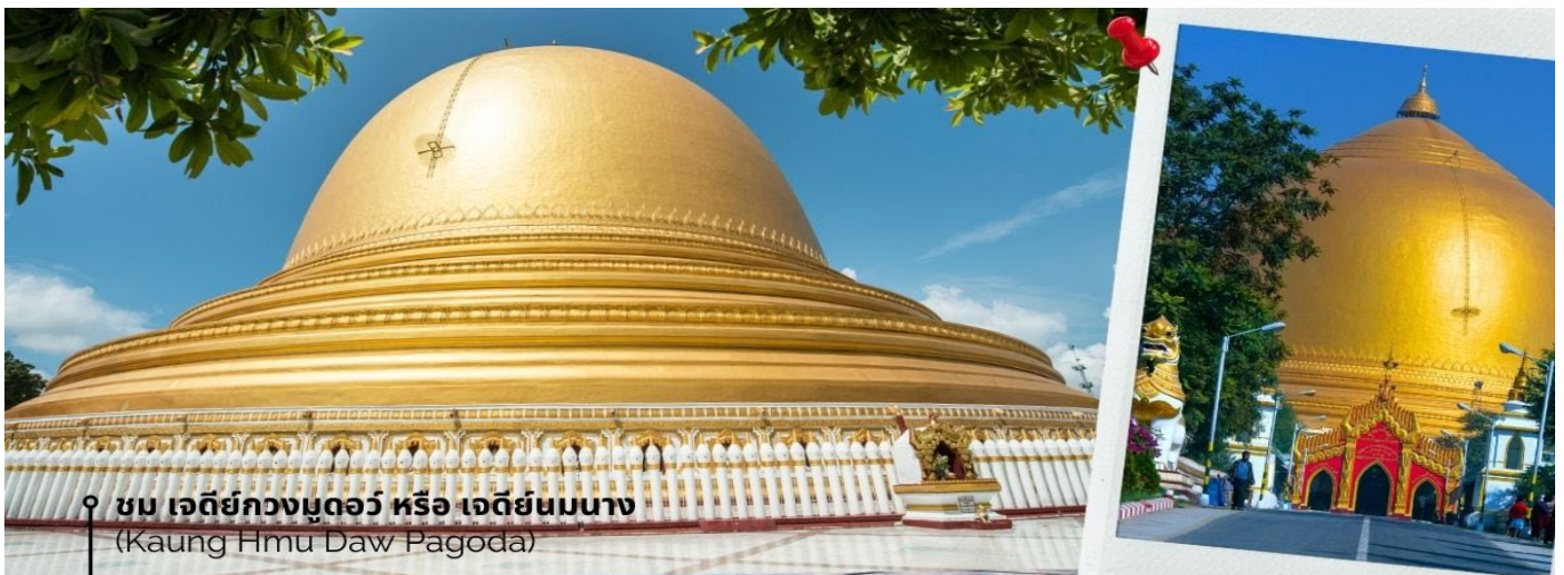
ชม เจดีย์กวงมุดอว์ หรือ เจดีย์นมนาง (Kaung Hmu Daw Pagoda)

นำท่านชม เจดีย์กวงมุดอว์ หรือ เจดีย์นมนาง (Kaung Hmu Daw Pagoda) เป็นเจดีย์พุทธขนาดใหญ่ ตั้งอยู่เขตชานเมืองทางตะวันตกเฉียงเหนือของชะไค้ โดยจำลองตามสัณฐานมาลีมาเจดีย์ ในประเทศศรีลังกา ฐานชั้นล่างสุดของเจดีย์ประดับด้วยนระและเทวดา 120 องค์ ล้อมรอบด้วยโคมหิน 802 ต้น ซึ่งแกะสลักพร้อมจารึกพุทธประวัติสามภาษา ได้แก่ พม่า, มอญ และไทใหญ่ เป็นตัวแทนของสามภูมิภาคหลักสมัยอาณาจักรตองอูยุคฟื้นฟู โดมของเจดีย์ได้รับการทาสีขาวอย่างต่อเนื่อง เพื่อแสดงถึง