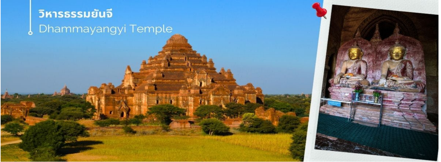
วิหารธรรมยันจี Dhammayangyi Temple

จากนั้นชม วิหารธรรมยันจี (Dhammayangyi Temple) เป็นวัดในเมืองพุกาม ประเทศพม่า เป็นวัดขนาดใหญ่ที่สุดในพุกามสร้างในรัชกาลพระเจ้านเรศวร กษัตริย์แห่งราชวงศ์พุกาม ได้ชื่อว่าเป็นผู้โหดร้ายและเป็นจุดเริ่มต้นความเสื่อมของอาณาจักรพุกาม มีพระนามที่เป็นที่รู้จักอีกพระนามหนึ่งว่า "อิมตอวสยน์" ที่ได้ชื่อว่าเป็นกษัตริย์จอมโหด เนื่องจากทรงลอบปลงพระชนม์พระบิดาคือ พระเจ้าอะลองสิธู และพระเจ้ามินซันสอ พระเชษฐา เพื่อขึ้นครองราชย์ จึงเชื่อกันว่าทรงสร้างวัดอันใหญ่โตนี้เพื่อไถ่บาปของพระองค์เอง