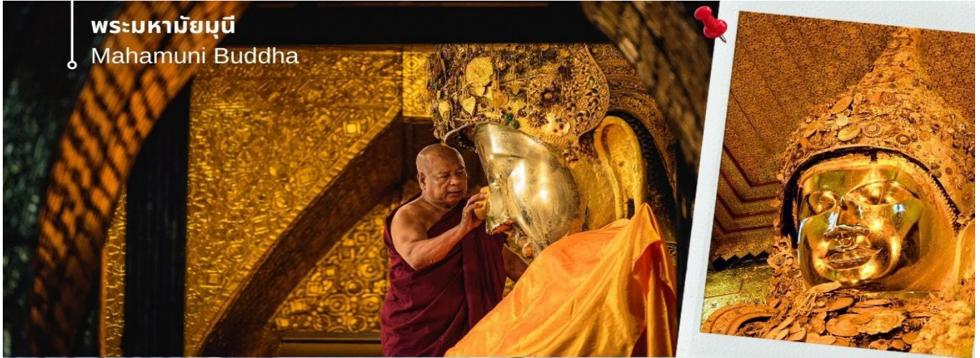
พระมหามัญมุนี Mahamuni Buddha

☎ บริการอาหารเช้า ณ ห้องอาหารของโรงแรม (8) นำท่านเดินทางสู่ เมืองสกายน์ หรือชะไค้ (Sagaing) ตั้งอยู่บนฝั่งขวาของแม่น้ำอิรวดี ตรงข้ามกับเมืองอังวะ เมืองชะไค้มีวัดทางพุทธศาสนาที่สำคัญหลายแห่ง เมืองสร้างขึ้นตั้งแต่คริสต์ศตวรรษที่ 14 เพื่อเป็นเมืองหลวงของอาณาจักรชะไค้ ซึ่งเป็นหนึ่ง