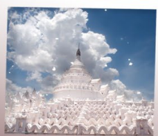
เจดีย์ชินพิวมิน