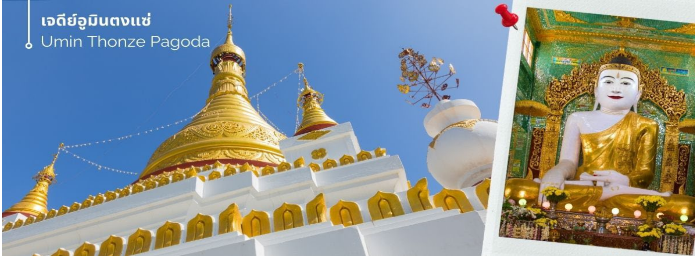
เจดีย์อุมินตงแซ่ Umin Thonze Pagoda

จากนั้นนำท่านชม เจดีย์อุมินตงแซ่ ขอพร พระทันใจ (Umin Thonze Pagoda) ตั้งอยู่ที่ดอยสุริยะอุมินตงแซ่ อยู่ทางเหนือประมาณ 1200 เมตร เป็นวัดผสมผสานที่มีชื่อเสียงที่สุดคือ ทางเดินรูปพระจันทร์เสี้ยว ภายในมีพระพุทธรูป 45 องค์ ทางเดินรูปพระจันทร์เสี้ยวทั้งหลังมีซุ้มประดับประดาสวยงามทั้งหมด 30 ซุ้ม หมายถึง ถ้ำที่พระสงฆ์หนึ่งสมาธิ ส่วนชื่อวัด อุมิน แปลว่า ถ้ำ ตงแซ่ หมายถึง 30 ด้าน ด้านข้างทางเดินมีพระวิหารสี่เหลี่ยม ภายในประดิษฐานพระพุทธรูปขนาดต่างๆ กว่าสิบองค์ บนเนินเขาด้านหลังทางเดินยังมีกลุ่มพระอุโบสถและเจดีย์ที่มองเห็นทิวทัศน์ที่สวยงามของภูเขาสุริยะและแม่น้ำอิรวดี