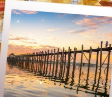
สะพานไม้จูปิง