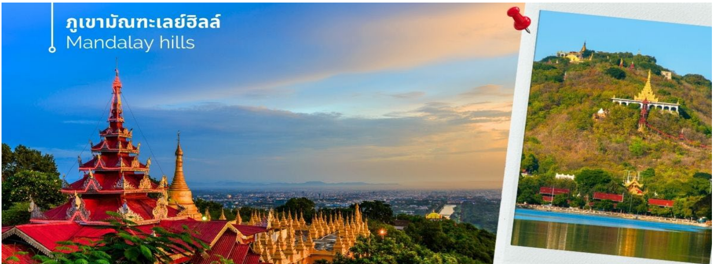
ภูเขาฆัณฑะเลย์ฮิลล์ Mandalay hills

ที่สำคัญสำหรับชาวพุทธพม่ามาเกือบสองศตวรรษ สักการะสิ่งศักดิ์สิทธิ์ ที่อยู่บนภูเขาฆัณฑะเลย์รอบวิหารมีระเบียบสำหรับชม ทัศนียภาพเมืองฆัณฑะเลย์ และสามารถมองเห็นแม่น้ำอิระวดี พระบรมมหาราชวัง วัดกุโสดอร์