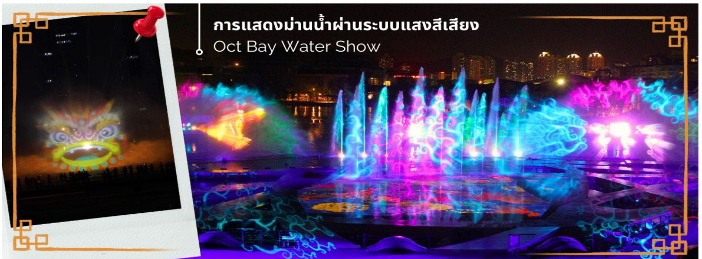
การแสดงม่านน้ำผ่านระบบแสงสีเสียง Oct Bay Water Show

จากนั้นนำท่าน ชมการแสดงม่านน้ำผ่านระบบแสงสีเสียง OCT BAY WATER SHOW เป็นโชว์ม่านน้ำแบบ 3 มิติ ที่ใช้ทุนสร้างกว่า 200 ล้านบาท จัดแสดงที่ OCT BAY Water Show Theatre Shenzhen ซึ่งเป็นโรงละครทางน้ำขนาดใหญ่ที่สามารถจุได้ถึง 2,595 คน เป็นโชว์ที่เกี่ยวกับเด็กหญิงผู้กล้ากับสิ่งวิเศษที่ออกตามหาเครื่องบรรเลงเพลงที่มีชื่อว่าป๊ากแห่งความรัก เพื่อเอามาช่วยนกที่ถูกทำลายจากมนต์ (มลพิษ) ในป่าโกงกาง การแสดงใช้อุปกรณ์ เช่น แสงเลเซอร์ ไฟ เครื่องเปล่งแสง ม่านน้ำ ระเบิดน้ำ กว่า 600 ชนิด เป็นโชว์น้ำที่ใหญ่ และทันสมัยที่สุดในโลก