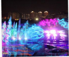
โชว์ม่านน้ำสามมิติ OCT BAY WATER SHOW