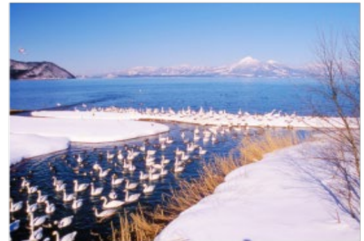
ทะเลสาบอินาวะชิโร Inawashiro-ko