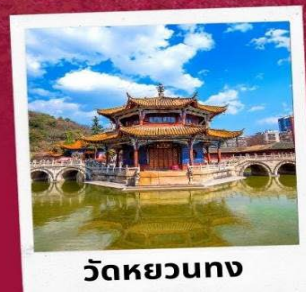
วัดหยวนทอง