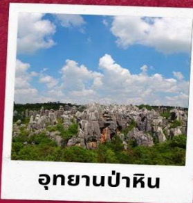
อุทยานป่าหิน