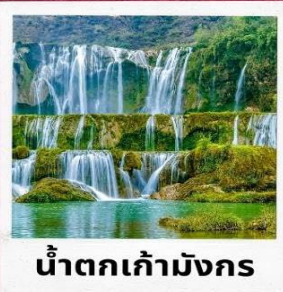
น้ำตกเก้ามังกร