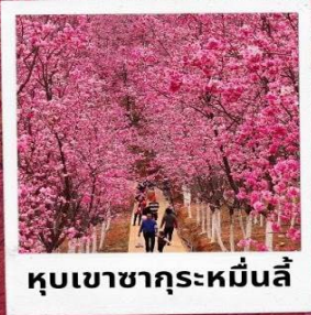
หุบเขาซากุระหมื่นลี