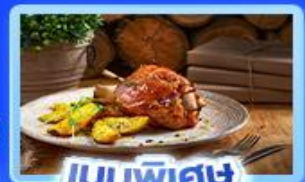
เมนูพิเศษ ขาหมูเยอรมัน