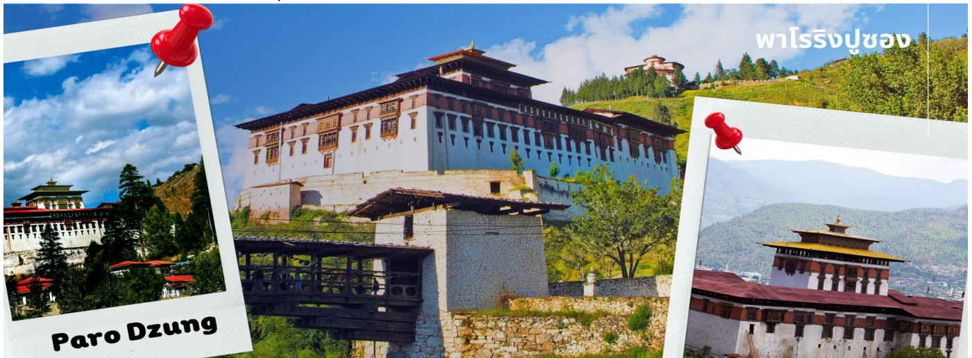
พาโรซองปูซอง

นำท่านเดินทางไม่ไกล ชม พิพิธภัณฑ์สถานแห่งชาติ พิพิธภัณฑ์แห่งนี้เป็นที่เก็บรวบรวมหน้ากากศิลปะแบบพุทธมหายาน นิกายตันตระ ภาพพระบฏ อวทูธ เหริยญญาปณ์ เครื่องมือเครื่องใช้ไม้สอยต่างๆ รวมถึงจัดแสดง ความหลากหลายทางธรรมชาติอันสมบูรณ์ของประเทศเพื่อให้ทุกท่านได้รู้จักภูฏานมากขึ้น ตรงข้ามกับอาคารพิพิธภัณฑ์ เป็นอาคารทรงกลมสีขาว เรียกว่า ตาซอง (Ta Dzong) หรือ หอคอย เดิมใช้เป็นหอสังเกตการณ์ข้าศึกศัตรูเนื่องจาก สร้างอยู่บนเนินสูง สามารถมองวิวตัวเมืองพาโรได้โดยรอบ