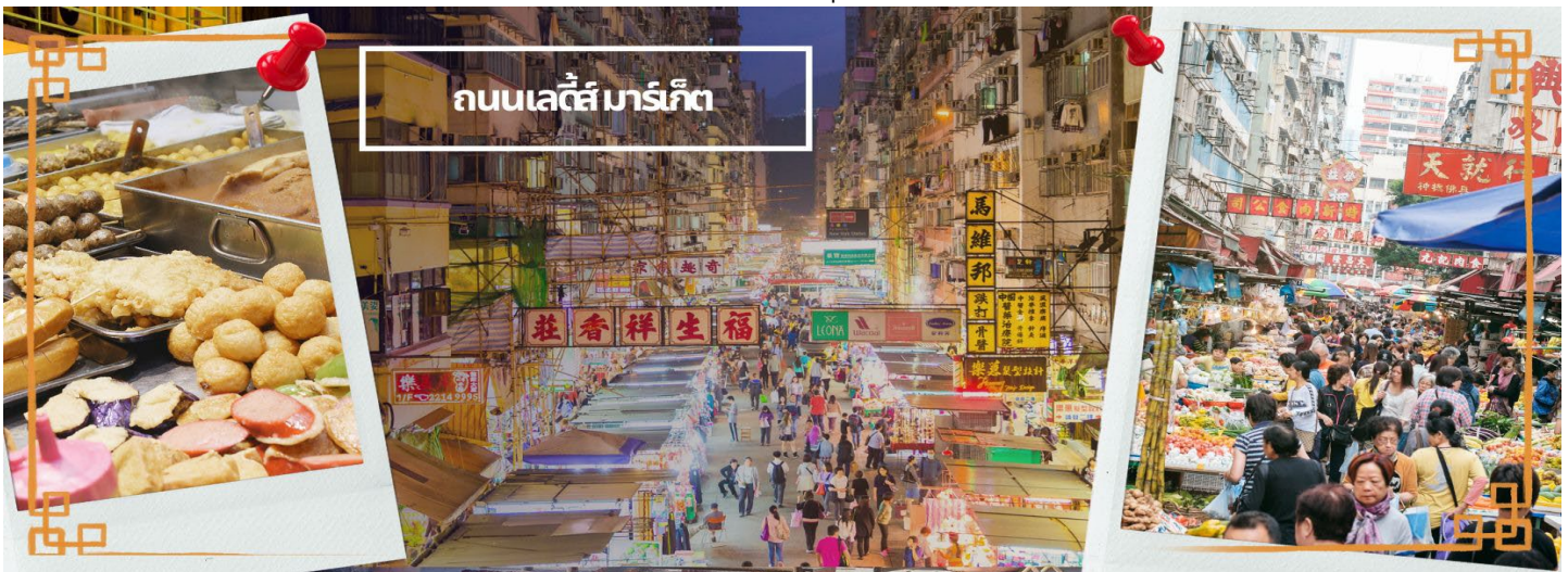
ถนนเลดี้ส์ มาร์เก็ต

จากนั้นนำท่านเดินทางสู่ ย่านมงก๊ก เป็นย่านที่มีความคึกคักที่สุดแห่งหนึ่งในเกาะฮ่องกงก็ว่าได้ เป็นสวรรค์ของนักช้อปปิ้งหนึ่งที่ สายช้อปปิ้งจะพลาดไม่ได้ นับได้ว่าเป็นย่านช้อปปิ้งที่คึกคักมากอีกแห่งหนึ่งของฮ่องกงเพราะเป็นย่านช้อปปิ้งที่มีทั้งร้านค้า และคนที่มาช้อปปิ้งจากที่ต่างๆ มากมายไม่ขาดสายตั้งแต่กลางวันยันกลางคืน เป็นถนนช้อปปิ้งที่มีสีสันมาก ถ้าเทียบกับญี่ปุ่นแล้วก็เปรียบเหมือนการเดินทางอยู่ที่ชิบูย่าเลยก็ว่าได้ และยังมี ถนนเลดี้ส์ มาร์เก็ต (LADIES MARKET) ที่มีทั้งเครื่องสำอาง เสื้อผ้า รองเท้า กระเป๋า เครื่องประดับมากมายให้เลือกช้อปปิ้ง อีกทั้งยังมีร้านอาหารและเครื่องดื่ม ที่ขึ้นชื่อหลากหลายชนิด ให้ทุกท่านได้ลองลิ้มรสอีกมากมาย