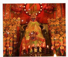
เจ้าแม่กวนอิมวัดสองห้า