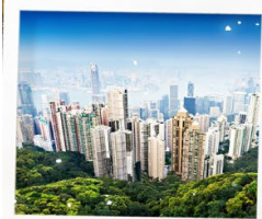
จุดชมวิวยาววิคตอเรีย