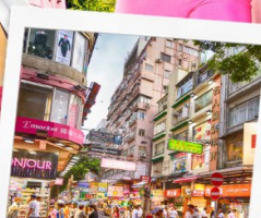
ช้อปปิ้งย่านมงก๊ก