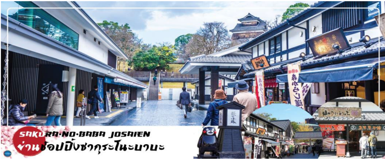
SAKURA-NO-BABA JOSAIEN ย่านช้อปปิ้งซากุระโนะบาระ

01.45 น. เติร์ฟาสู่ เมืองฟุกุโอกะ ประเทศญี่ปุ่น โดยเที่ยวบินที่ FD736 08.55 น. เดินทางถึง ท่าอากาศยานนานาชาติฟุกุโอกะ ประเทศญี่ปุ่น นำท่านผ่านขั้นตอนการตรวจคนเข้าเมืองและศุลกากร เรียบร้อยแล้ว (เวลาที่ญี่ปุ่น เรียกว่าเมืองไทย 2 ชั่วโมง กรุณาปรับนาฬิกาของท่านเพื่อความสะดวกในการนัดหมายเวลา) ***สำคัญมาก!! ประเทศญี่ปุ่นไม่อนุญาตให้นำอาหารสด จำพวก เนื้อสัตว์ พืช ผัก ผลไม้ เข้าประเทศ หากฝ่าฝืนมีโทษปรับและจับ