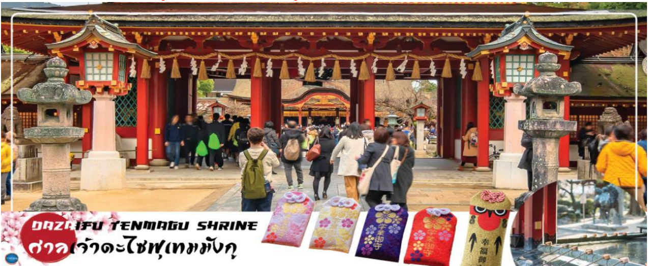
DAZAIFU TENMANGU SHRINE ศาลเจ้าเดะไซฟูเทมมังกุ

เที่ยง เลือกรับประทานอาหารกลางวัน ณ หมู่บ้านยุฟูอินตามอัตราค่า (3) Cash Back ท่านละ 1000 เยน (จ่ายโดยไกด์หน้างาน)