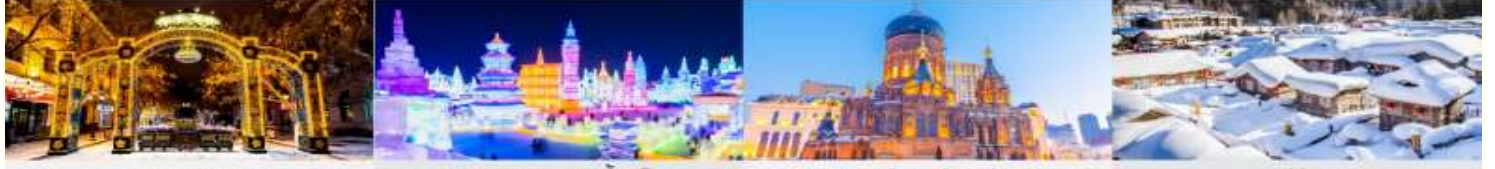
ถนนคนเดินจงหยาง เทศกาลโคนไฟน้ำแข็ง โบสถ์เซนต์โซเฟีย หมู่บ้านหิมะ

*ทางบริษัทฯ ขอสงวนสิทธิ์ในการสืบโปรแกรมทัวร์ตามความเหมาะสมขึ้นอยู่กับสถานการณ์ปัจจุบัน โดยคำนึงถึงผลประโยชน์ของลูกค้าเป็นสำคัญ