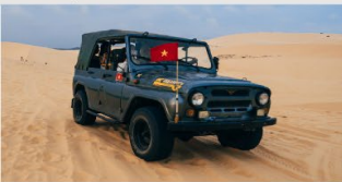
ทะเลทรายขาว