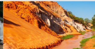
ลำธารนางฟ้า

*ทางบริษัทฯ ขอสงวนสิทธิ์ในการสลับโปรแกรมทัวร์ตามความเหมาะสมขึ้นอยู่กับสถานการณ์หน้างาน โดยคำนึงถึงผลประโยชน์ของลูกค้าเป็นสำคัญ