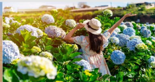
สวนดอกไฮเดรนเยีย