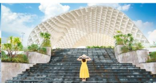
สวนเอเปก