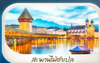
สะพานไมซ์ฮาเปล