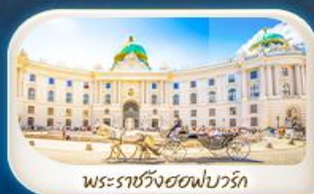
พระราชวังฮอฟบวร์ก

12-18 มี.ค.68 / 19-25 มี.ค.68 28 เม.ย. - 4 พ.ค.68 7-13 พ.ค.68