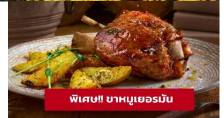
พิเศษ!! ขาหมูเยอรมัน

เกียง 🍴 รับประทานอาหารเกียง (เมื่อที่5) เมนูพิเศษ! ขาหมูเยอรมัน นำท่านเดินทางสู่ เมืองซูริก (Zurich) ประเทศสวิตเซอร์แลนด์ (ระยะทาง 275 กม. / 4 ชม.) เมืองที่ใหญ่ที่สุดในประเทศ เป็นศูนย์รวมทุกสิ่งของประเทศ เป็นเมืองเก่าเต็มไปด้วยอาคารยุคกลางและพิพิธภัณฑ์