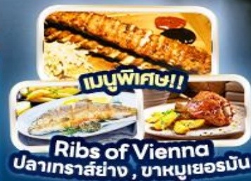
เมนูพิเศษ!! Ribs of Vienna ปลาเทราลย่าง, ไข่หมูเยอรมัน