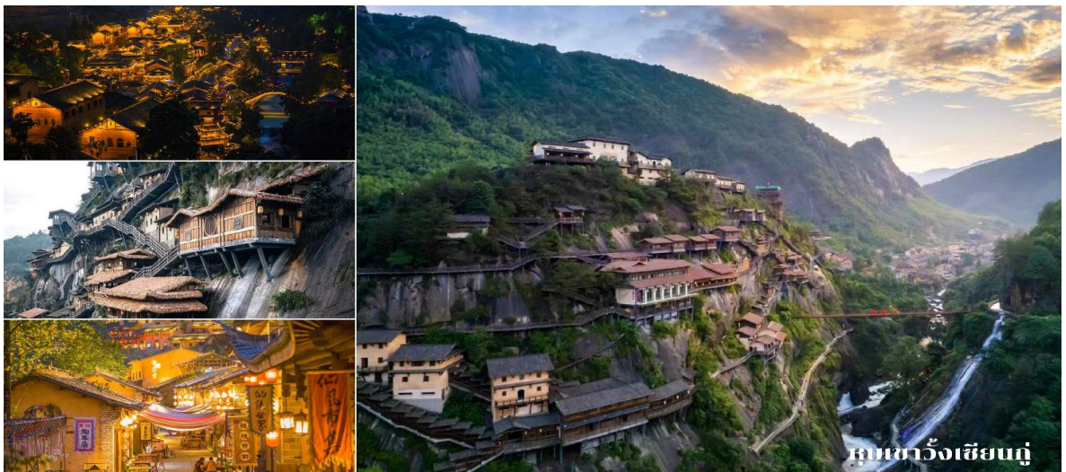
ถนนฉางเจียนกู่

นำท่านชม ทิวทัศน์ยามค่ำคินหุบเขาฉางเจียนกู่ ซึ่งเรียกว่าเป็นจุดไฮไลต์หลักของเมืองแห่งนี้ เมื่อถึงเวลาค่ำคินทั้งเมืองจะเปิดไฟทั่วทั้งเมือง แสงไฟวิบวับ บรรยากาศดุจตั้งเมืองสวรรค์ในแดนดิน