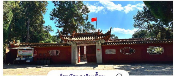
ตำหนักทองจีนเตี้ยน

นำท่านชมความงามของ ตำหนักทองจีนเตี้ยน ในอดีตเคยเป็นที่พักของคู่ชันท้าทาย “ขุนศึกผู้ขายชาติ” และนางงามเงินหยวนหยวน เป็นตำหนักที่มีฝาผนังและหลังคาสร้างด้วยทองเหลืองถึง 380 ตัน จึงทำให้ตำหนักมีความสวยเด่น แลดูเสมือนทอง จึงได้ชื่อว่า “ตำหนักทอง” นับได้ว่าเป็นตำหนักที่ใหญ่ที่สุดของจีน