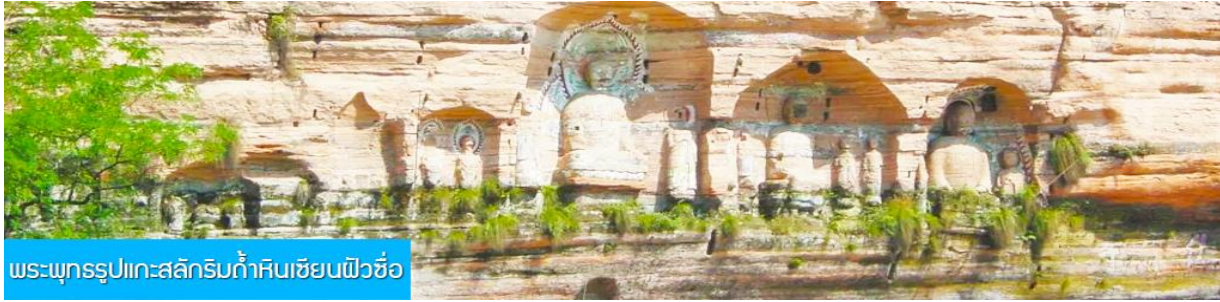
พระพุทธรูปแกะสลักกริมถ้ำหินเซียนฝิวชื่อ