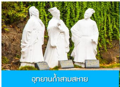
อุทยานถ้ำสามสหาย