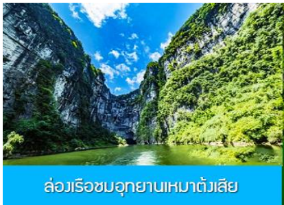
ล่องเรือชมอุทยานเหมาดังเสียดีย