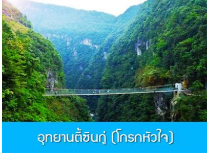
อุทยานตี้ซิงกู (โกรกหัวใจ)

พักที่ โรงแรม ENSHI XIPU HOTEL ระดับ 4 ดาวท้องถิ่นหรือเทียบเท่าในเมืองเินซือ