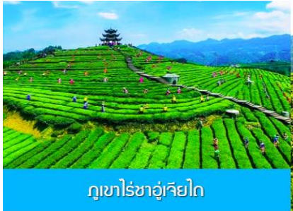
ภูเขาไร่ชาอู่เจียโก

พักที่ โรงแรม ENSHI XIPU HOTEL ระดับ 4 ดาวห้องดีนหรือเทียบเท่าในเมืองเฉินซือ