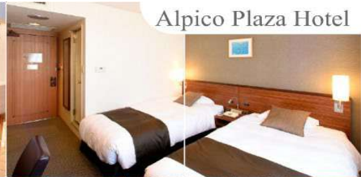
Alpico Plaza Hotel