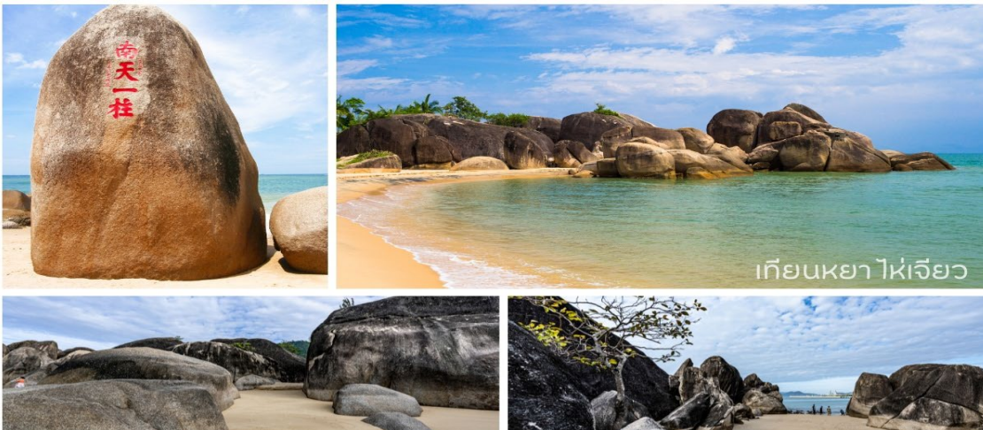
เทียนหยาดี้

นำท่านเดินทางสู่ อุทยานสุดขอบฟ้าจรดทะเล (เทียนย่าไห่เจี๋ยว) หรือแหลมหินเทียนหยาดี้ (Tianya-Haijiao) ซึ่งแปลว่า "ขอบฟ้าสวรรค์" เป็นหนึ่งในสถานที่ท่องเที่ยวที่มีชื่อเสียงและเป็นที่นิยมของกลุ่มแต่งงานคู่รักวัยรุ่น คู่ฮันนีมูนที่มาขอพรเพื่อความสุขในการดำเนินชีวิตคู่ อีสระให้ท่านได้สูดรับลมทะเลอันบริสุทธิ์ พร้อมเพลิดเพลินกับการชมทัศนียภาพอันสวยงาม และทรายที่งดงาม ทิวทัศน์อันกว้างใหญ่ของมหาสมุทรเบื้องหน้า(ไม่รวมรถออล์ฟ)