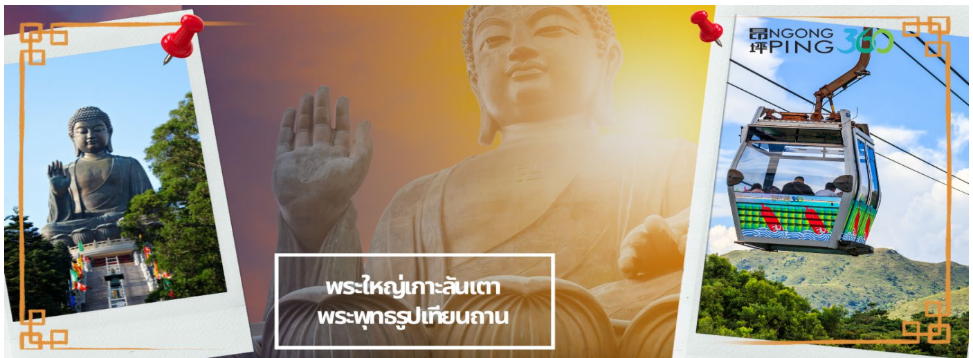
พระใหญ่เกาะลันเตา พระพุทธรูปเทียนถาน

จากนั้นนั่งกระเช้ากลับลงมายังสถานีตุงซุงและนำท่านช้อปปิงที่ ซิตี เกท เอาท์เล็ต (CITY GATE OUTLET) เป็นเอาท์เล็ตขนาดใหญ่ที่สุดของฮ่องกง อยู่ใกล้กับสนามบินฮ่องกง ติดกับสถานีรถไฟ TUNG CHUNG STATION ซึ่งมีสินค้าแบรนด์เนมระดับโลกมากมาย เป็นที่นิยมของนักท่องเที่ยวหรือแม้กระทั่งคนท้องถิ่นเอง ก็มาช้อปปิงกันที่นี่ นอกจากส่วนของห้างแล้วยังมีร้านอาหารต่างๆ, ศูนย์อาหาร FOOD REPUBLIC, ซูเปอร์มาร์เก็ต, โรงภาพยนตร์ และโรงแรม NOVOTEL CITY GATE HONG KONG ห้าง CITY GATE OUTLET มีแบรนด์ต่างๆให้เลือกมากกว่า 90 แรนต์ เช่น NIKE, ADDIDAS, NEW BALANCE, BURBERRY, COACH, MICHEL KOR, KATE SPADE, POLO RALPH LAUREN, THE NORTHFACE, ARMANI EXCHANGE, BALLY, CROCS, COLUMBIA, ESPRIT, EVISU, GUESS, GIORDANO, LEVIS, LACOSTE, PUMA, TUMI และ TIMBERLAND ให้ท่านได้ช้อปปิงกันอย่างจุใจ