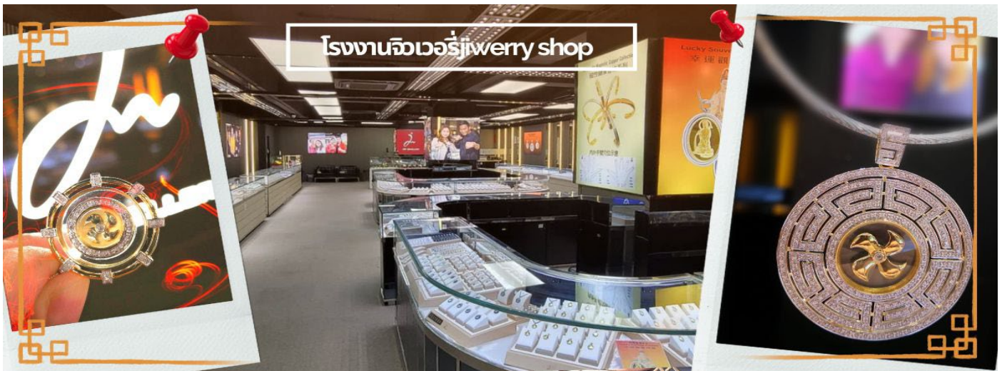
โรงงานจิวเวอรี่ jewelry shop

จากนั้นนำท่านชม โรงงานจิวเวอรี่ ซึ่งเป็นโรงงานที่มีชื่อเสียงที่สุดของฮ่องกงในเรื่องการออกแบบเครื่องประดับ อาทิเช่น จี้ และแหวนกำหั้น ที่สวยงามโดดเด่นไม่เหมือนใคร ซึ่งถือกำเนิดขึ้นที่นี่และมีชื่อเสียงที่สุดใช้เป็นเครื่องประดับติดตัว และเสริมดวงชะตา สินค้าทุกชิ้นมีเอกสารรับประกันคุณภาพเปลี่ยน ซ่อม ได้ตลอดอายุการใช้งาน หากเกิดการชำรุดจากสินค้าไม่ใช่อุบัติเหตุ และนำท่านเลือกซื้อ เครื่องประดับที่ ร้านหยก ซึ่งคนจีนนั้นถือว่าหยกเป็นหิน ที่เป็นตัวแทนของความสวยงามและความบริสุทธิ์ มีความเชื่อว่าหยกมงคล ถ้าพกติดตัวไว้จะอายุยืนและสุขภาพดี