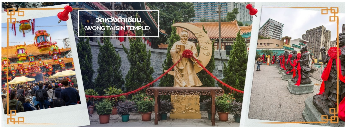
ผูกด้ายดวงชะตา ระหว่างคู่รักซึ่งเมื่อคู่กันแล้วก็จะไม่แคล้วคลาดกัน