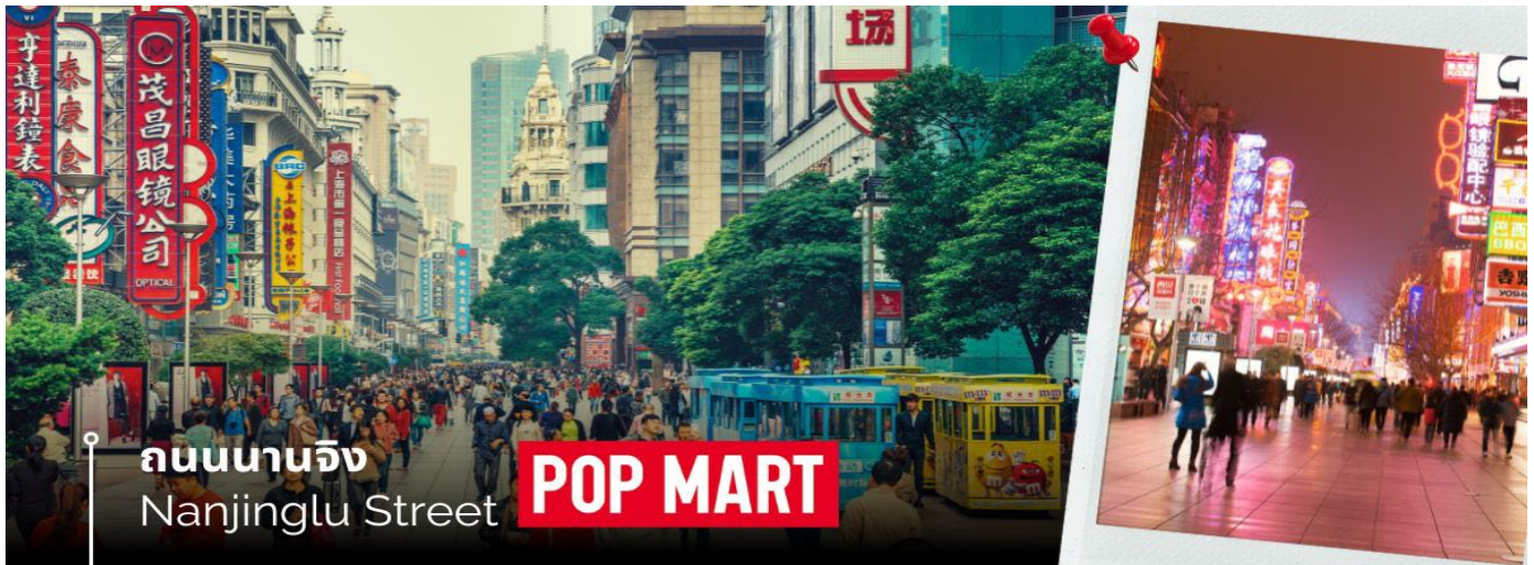
ถนนนานจิง Nanjinglu Street POP MART

นำท่านสู่บริเวณ หาดไว่ทาน ตั้งอยู่บนฝั่งตะวันตกของแม่น้ำหวงผู้มีความยาวจากเหนือจรดใต้ถึง 4 กิโลเมตรเป็นเขตสถาปัตยกรรมที่ได้ชื่อว่า “พิพิธภัณฑ์สิ่งก่อสร้างหมื่นปีแห่งชาติจีน” ถือเป็นสัญลักษณ์ที่โดดเด่นของนครเซี่ยงไฮ้ และนำท่านช้อปปิ้งย่าน ถนนนานจิง Nanjinglu Street ศูนย์กลางสำหรับการช้อปปิ้งที่คึกคักมากที่สุดของนครเซี่ยงไฮ้ รวมทั้งห้างสรรพสินค้าใหญ่ชื่อดังกว่า 10 แห่ง และช้อปปิ้ง ร้าน POP MART สุดฮิตในขณะนี้เพื่อเป็นของฝากที่ระลึกให้แก่ญาติสนิทมิตรสหาย