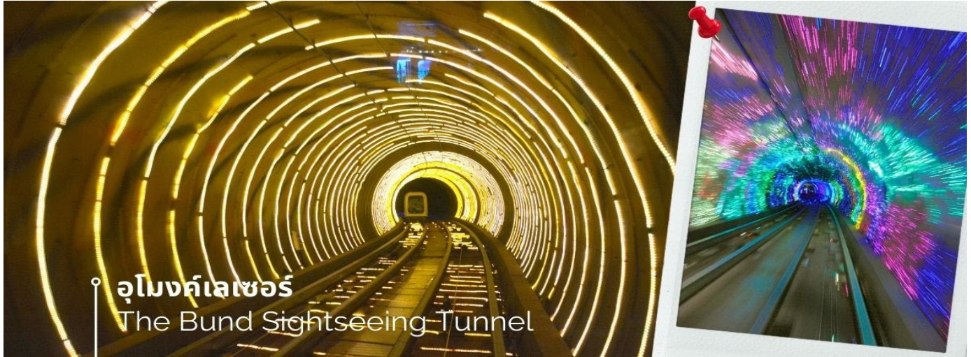
อุโมงค์เลเซอร์ The Bund Sightseeing Tunnel

เมื่อชมวิว ถ่ายรูปกันจนหน้าใจแล้ว นำท่านเดินมาทางเข้าอุโมงค์เลเซอร์ ซึ่งเป็นอุโมงค์ลอดแม่น้ำแห่งแรกในประเทศจีนโดยอุโมงค์นี้จะพาเราเดินทางข้ามจากฝั่งหอไข่มุกตะวันออก ของหาดไว่ทาน จากนั้นนำท่านเปิดประสบการณ์ใหม่กับ The Bund Sightseeing Tunnel อุโมงค์เลเซอร์ เชียงไฮ้ ถูกสร้างขึ้นเพื่อให้ใช้เป็นเส้นทางขนส่งนักท่องเที่ยวที่มั่งคั่งที่มาจากทั่วทุกมุมโลกที่มาเที่ยวที่นครเซี่ยงไฮ้ ทางนครเซี่ยงไฮ้ได้ติดตั้งระบบแสงสีเสียงสุดอลังการภายในอุโมงค์แห่งนี้ ทำให้ช่วงเวลาระหว่างอยู่บนรถอัตโนมัติภายในอุโมงค์แห่งนี้ เหมือนอยู่ในอีกโลกหนึ่ง