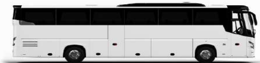
ตัวอย่างรถปรับอากาศ 1 ชั้น

ค่าที่พักตามที่ระบุในรายการหรือเทียบเท่าระดับเดียวกัน (พักห้องละ 2 ท่าน) หากประเภทห้องที่ท่านริเคอมาเดิมจาก เช่น ริเคอสห้องพักเป็น TWIN BED หรือ DOUBLE BED ทางบริษัทฯขอสงวนสิทธิ์ในการปรับประเภทห้องพัก เป็นตามที่โรงแรมมีอยู่ โดยไม่ต้องแจ้งให้ทราบล่วงหน้า