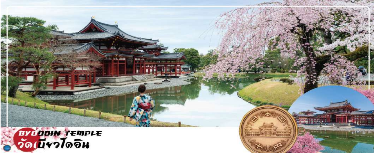
BYODOIN TEMPLE วัดเบียวโดอิน

วันที่สอง ท่าอากาศยานนานาชาติคันไซ โอซาก้า ประเทศญี่ปุ่น – เมืองเกียวโต – เมืองอุจิ – วัดเบียวโดอิน (จุดชมซากุระขึ้นกับภูมิอากาศ) – ถนนเบียวโดอิน โอโมเตะซันโด (ถนนชาเขียว) – สะพานอุจิ – เมืองนาโกย่า – ซุปป์ิ้งย่านซาคาเอะ