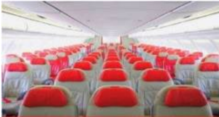
เครื่องบินใหญ่ 377 ที่นั่ง

ตัวเครื่องบินเป็นตัวรูปสำหรับคณะทัวร์ ระบบของสายการบินจะทำการแรนดอมที่นั่ง ซึ่งไม่สามารถล็อกหรือเลือกที่นั่งได้ หากลูกค้าต้องการเลือกที่นั่ง ทางสายการบินมีบริการอัพเกรดที่นั่ง (ค่าบริการเป็นไปตามที่สายการบินกำหนด)