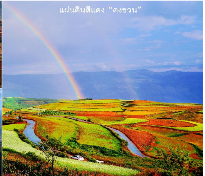
แผ่นดินสีแดง “ดงชวน”

จากนั้นนำท่านเดินทางกลับคุนหมิง นำท่านชมสินค้าพื้นเมืองร้านหยก จากนั้นนำท่านชม ซุ้มประตูม้าทองและซุ้มประตูไก่อมรกต ซึ่งภาษาจีนเรียกว่าจินหมาและปี้จี้จิงเอาค้ายอ “จินปี้” มาชานานนามถนนว่าจินปี้ลู่ซึ่งก็คือ “ถนน(ม้า)ทอง(ไก่อมรกต)” ซุ้มจินหมาและซุ้มปี้จี้เริ่มสร้างขึ้นในรัชวงศ์เตอราชวงศ์หมิง ถึงปัจจุบันนี้มีประวัติร่วม 400 ปี ลวดลายซุ้มจินหมาปี้จี้เป็นตราสัญลักษณ์ของนครคุนหมิงมาตลอดในถนนย่านการค้าแห่งนี้ เป็นแหล่งเสื้อผ้าแบรนด์เนมทั้งของจีนและต่างประเทศ เครื่องประดับอัญมณีชั้นเยี่ยม ร้านเครื่องดื่ม ร้านอาหารพื้นเมือง และร้านขายของที่ระลึก อิสระช้อปปิ้ง ถนนคนเดินหนานผิงเจีย หรือถนนจินปี้ลู่ อยู่ในใจกลางเมืองคุนหมิง พลาดไม่ได้กับสินค้าร้าน POP MART ที่เป็นที่นิยมในประเทศจีนและชาวไทยเป็นอย่างมาก ให้ท่านได้ลุ้นตัวการ์ตูนที่ชื่นชอบตามอัธยาศัย