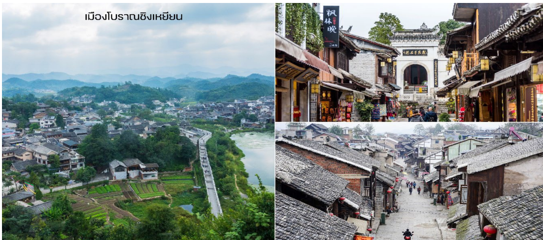
เมืองโบราณชิงเหยียน

นำท่านสู่ เมืองโบราณชิงเหยียน ในเมืองกุ้ยหยางชนวนชมภาพถ่ายของอาณาจักรเมืองโบราณชิงหยวน ในเมืองกุ้ยหยาง เมืองเอกของมณฑลกุ้ยโจว ทางภาคตะวันตกเฉียงใต้ของจีน โดยเมืองโบราณแห่งนี้สร้างขึ้นในสมัยจักรพรรดิหงอู่ แห่งราชวงศ์หมิง บรรยากาศหมู่บ้านดั้งเดิมที่งดงามร่มรื่น ดึงดูดนักท่องเที่ยวจำนวนมาก