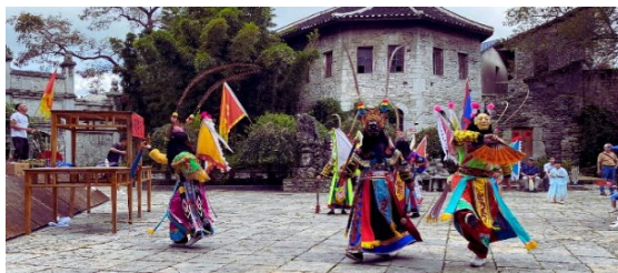
โบราณเทียนหลงตุนเป่า

นำท่านชมเมืองโบราณเทียนหลงตุนเป่า เป็นปราสาทหินมีอายุมากกว่า 600 ปี เป็นเมืองที่มีชื่อเสียงทางประวัติศาสตร์และวัฒนธรรมของราชวงศ์หมิง ยังคงมีสถานที่ทางประวัติศาสตร์และวัฒนธรรมที่อุดมสมบูรณ์ วัฒนธรรม ที่เป็นเอกลักษณ์ ได้รับยกย่องว่าเป็น "ประวัติศาสตร์ของราชวงศ์หมิงที่มีชีวิตอยู่"