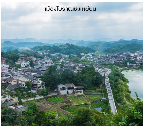
เมืองโบราณซิงเหยียน