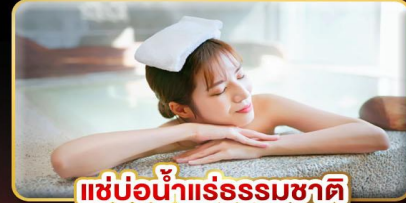
แช่น้ำแร่ธรรมชาติ