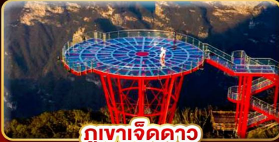
ภูเขาลูกคาง